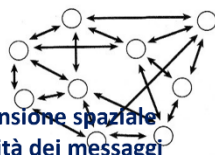
Rete a nodi o a maglie.