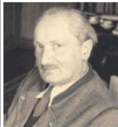
Martin Heidegger (1889-1976) è a tutti gli effetti un filosofo politico, come dimostrano i Quaderni neri : la sua adesione al nazismo ha influito sull'allontanamento della filosofia dalla politica

Non ne furono indenni neppure Hannah Arendt e Hans-Georg Gadamer, i primi heideggeriani li-