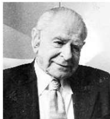
Karl Popper (Vienna 1902-Londra 1994) vedeva in Platone il fondatore della «società chiusa» e il teorico di ogni forma di totalitarismo con la sua concezione di uno «Stato educativo»

Proprio perché viviamo in tempi in cui la politica, ridotta a governance amministrativa, ha perso ogni capacità di visione, non c'è forse lettura più opportuna della Repubblica di Platone. Certo, si tratta di un testo molto controverso, che ha finito quasi per essere messo all'indice nell'epoca del neoliberismo. Nell'immediato dopoguerra Karl Popper credette di riconoscere in Platone il fondatore della «società chiusa» e di ogni totalitarismo a venire, non solo per il ruolo decisivo affidato alla filosofia, ma anche per l'idea di uno «Stato educativo» in grado di minacciare la libertà individuale. Da allora, e lungo tutto il Novecento, si sono moltiplicate