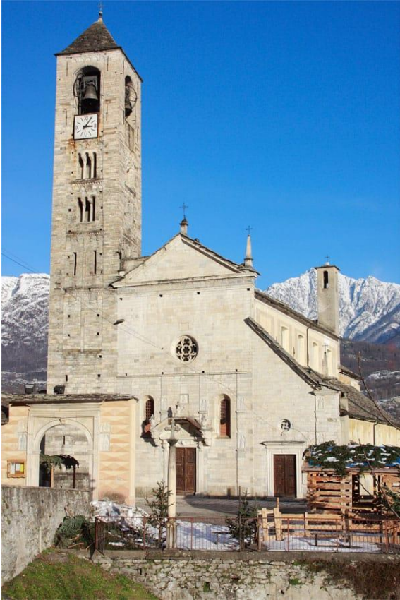
Chiesa dei Santi Pietro e Paolo a Crevoladossola