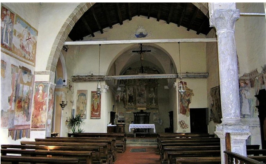
Interno chiesa Cornello dei Tasso

Partenza alle 14 rientro alle ore 18 circa. Il costo è di € 25, comprensivo dell'autobus.