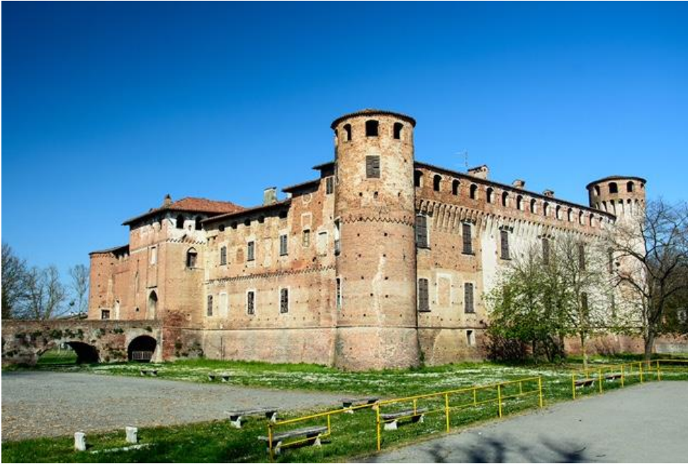
Il castello di Monticelli D'Ongina