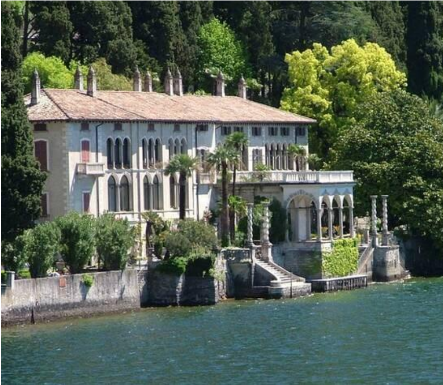
Villa Monastero - Varenna