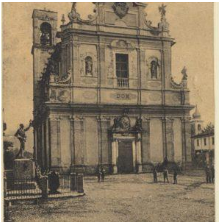
Chiesa prepositurale di Sorisole