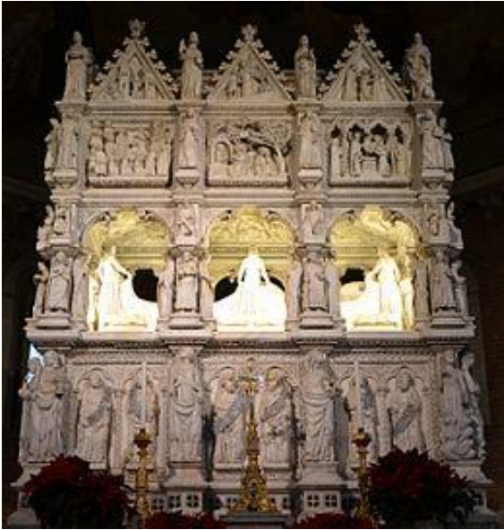
Arca di Sant'Agostino San Pietro in Ciel D'oro