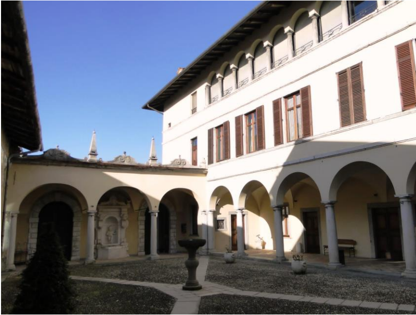
Palazzo Galizzi, Leffe