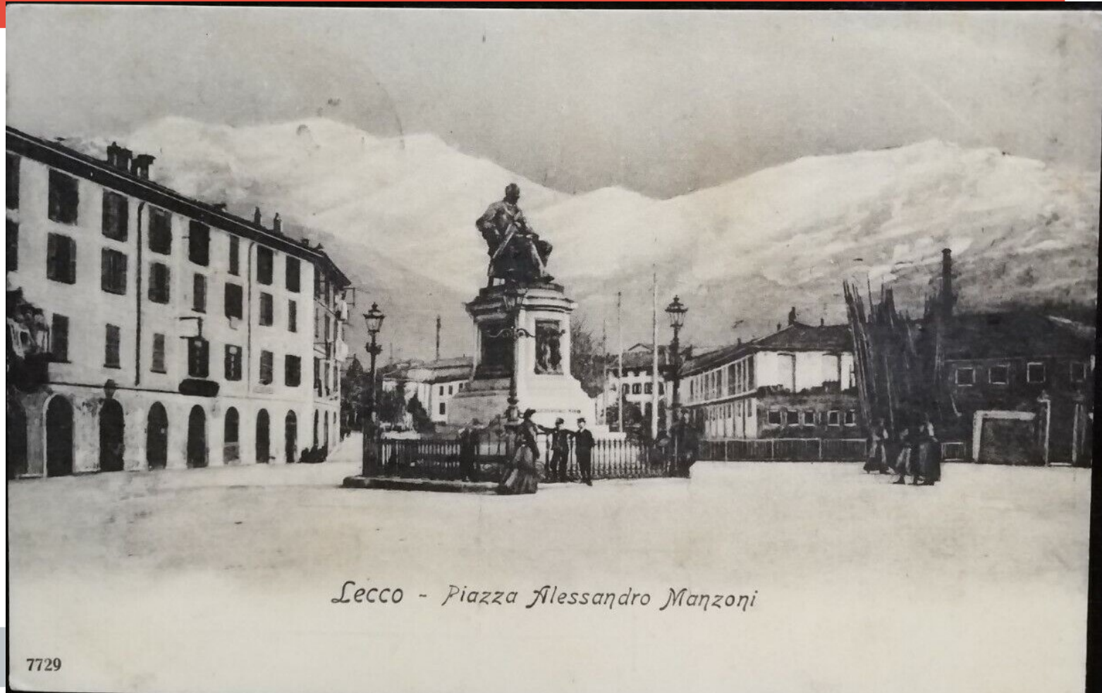
Lecco - Piazza Alessandro Manzoni

Piazza Alessandro Manzoni a Lecco in una cartolina degli inizi del XX secolo