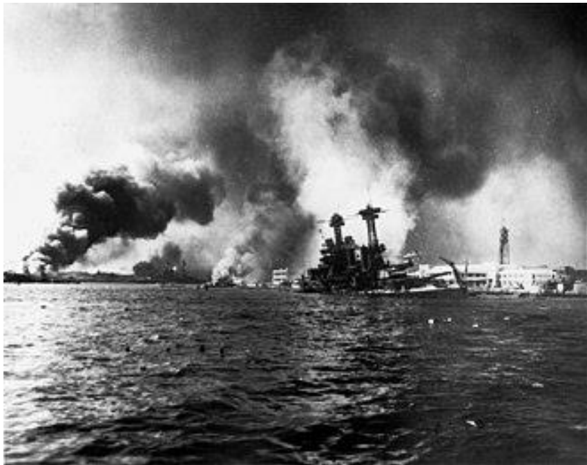
Corazzata Uss California affonda

Il Giappone non si fece intimorire e, nel 1941, bombardò Pearl Harbour in una azione a sorpresa avvenuta senza aver ancora riconosciuto lo stato di Guerra, per questo motivo passata alla storia come “La grande infamia”.