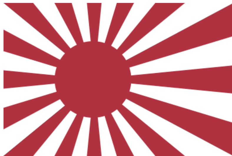
Bandiera della marina imperiale giapponese