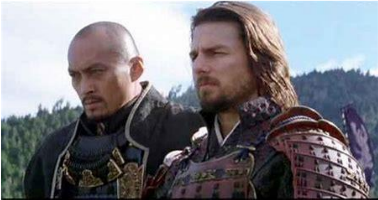
L'ultimo samurai, 2003

Si estinse la figura del samurai, fu vietato di portare la spada e vennero aboliti i privilegi della casta militare.