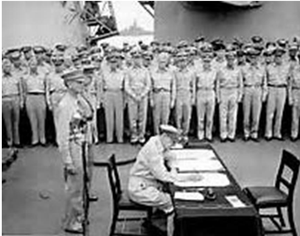
Corazzata USS Missouri, 2 settembre '45

Qualche giorno dopo, Hirohito fece un annuncio in diretta radiofonica al suo popolo: Il Giappone si era arreso e la guerra era terminata.