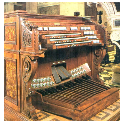
Bergamo - S.Maria Maggiore

L'arte organaria bergamasca è tra le più interessanti espressioni artistico-musicali che l'Italia possa vantare. E' costituita da un ricco patrimonio di strumenti musicali di rilevanza europea poco conosciuto dagli stessi bergamaschi. In provincia ci sono circa 600 organi, la maggioranza dei quali di interesse storico-artistico; sono sparsi ovunque tra le oltre 1500 chiese delle 430 parrocchie presenti nella provincia. Da pochi decenni questi strumenti trovano adeguata considerazione presso gli specialisti e gli storici; per il passato, venivano visti solo come delle complesse macchine musicali soggette a continue modifiche delle varie epoche; ora, invece, vengono valorizzati e tutelati per quello che storicamente rappresentano. La Bergamasca in tema di organi è in cattedra, sia per quello che ha storicamente dato all'Italia sia per quello che sta facendo per la valorizzazione e la tutela di questo pregevole patrimonio proponendosi come punto di riferimento. Di grande richiamo il "Festival organistico internazionale" che si tiene a Bergamo annualmente dal 1992, richiamando in città interpreti di grande fama che si cimentano sugli strumenti storici più significativi che si conservano nelle chiese cittadine.