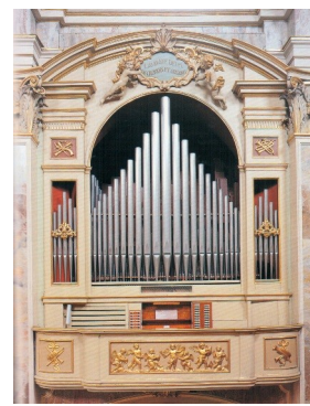
Bergamo S. Alessandro in croce, Serassi 1860 - 2 tastiere, 60 registri, 2787 canne