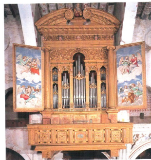
Almenno S.S., Antegnati 1588 Una tastiera, 9 registri, 464 canne

Si dice "facciata" o "prospetto" la porzione di canne che è visibile all'esterno. La facciata, anche detta " mostra ", di un organo differisce di caratteristiche stilistiche a differenza delle influenze artistiche delle varie aree geografiche. Nell'organo italiano la mostra si presenta sempre costituita da una cassa armonica, generalmente lignea, a forma di parallelepipedo decorata più o meno sfarzosamente, secondo le occasioni: vi sono alcune casse che hanno soltanto un timpano rettangolare sulla sommità, altre che sono decorate da colonne, fregi, archi e dipinti. Un'altra caratteristica della facciata dell'organo all'italiana è che, talvolta, lo spazio delle canne - in alcuni casi mute - può essere chiuso da portelle lignee dipinte ed intagliate.