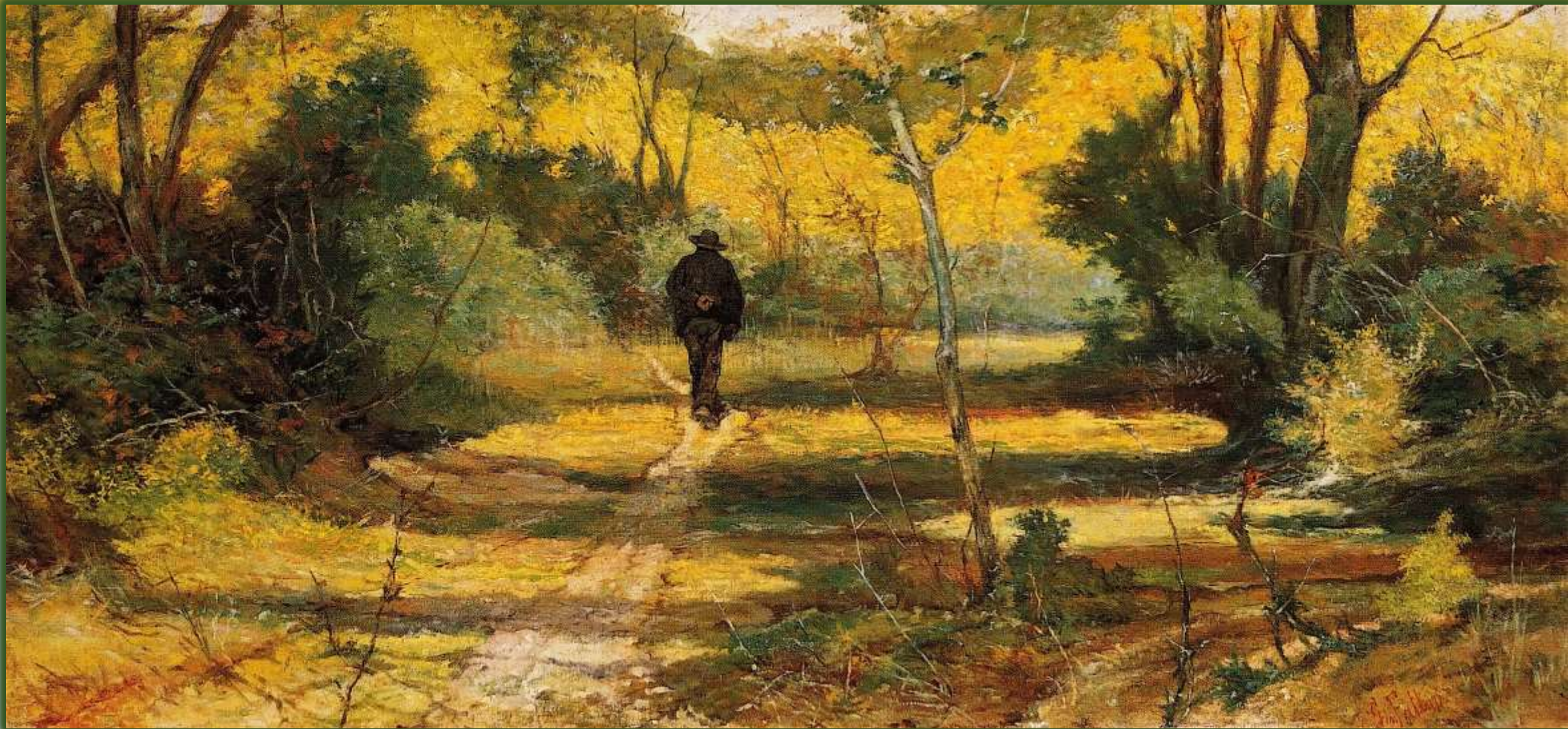
Giovanni FATTORI (1825-1908): L'uomo nel bosco 1890 ca. Olio su tela cm 45 x 97 – Collezione privata