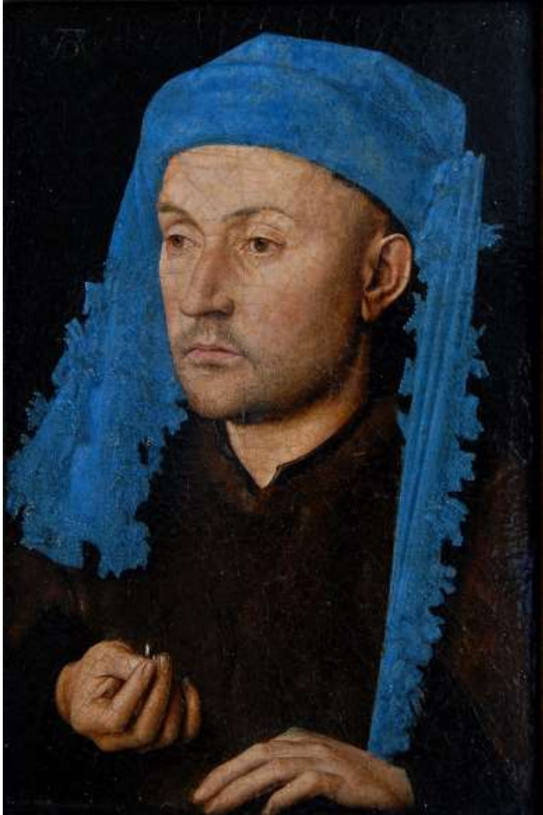
Jan van Eyck, Uomo con anello , 1430, Sibiu Museo Brukenthal -