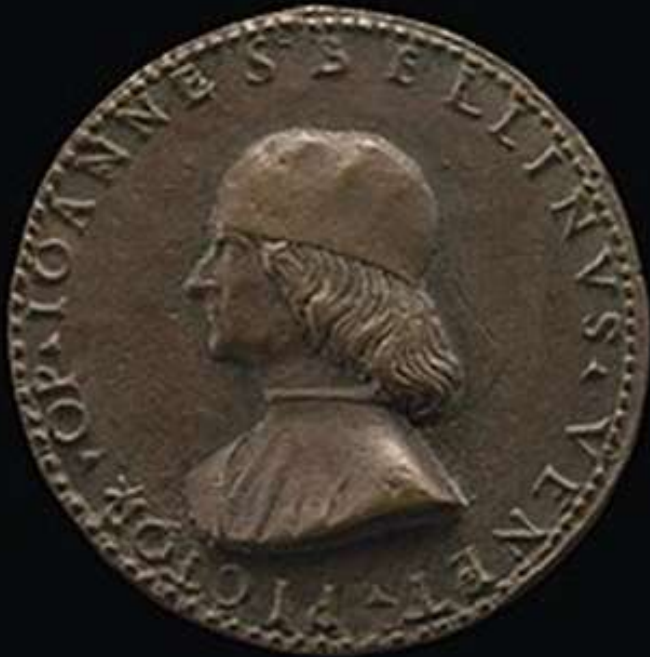
Vittore Gambello, Giovanni Bellini, pittore veneziano, 1470-1480 circa