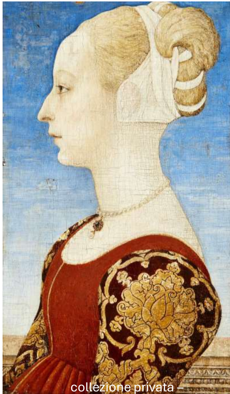
collezione privata –