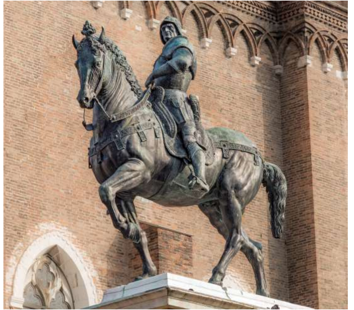
Andrea del Verrocchio, monumento equestre di Bartolomeo Colleoni , 1480 – 1488, Venezia