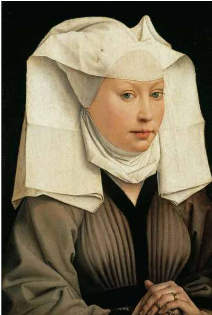
Ritratto di giovane donna, 1435 e 1460

Berlino, Gemäldegalerie - Washington, National Gallery of Art