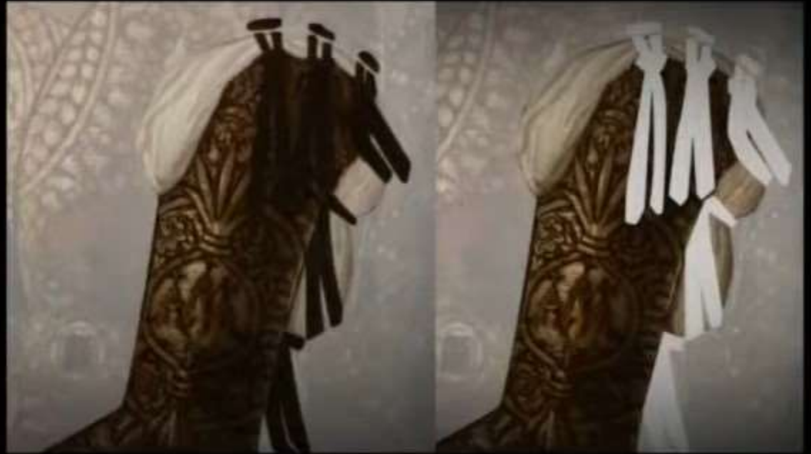
Ambrogio de Predis Bianca Maria Sforza, 1495-1495 Kunsthistorisches Museum Vienna