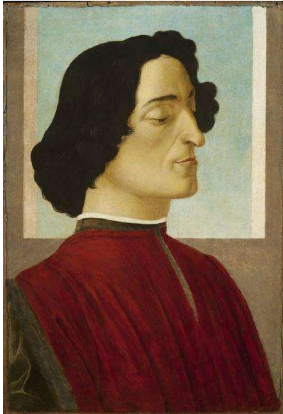
Sandro Botticelli, Ritratto di Giuliano de' Medici , 1478 - 1480