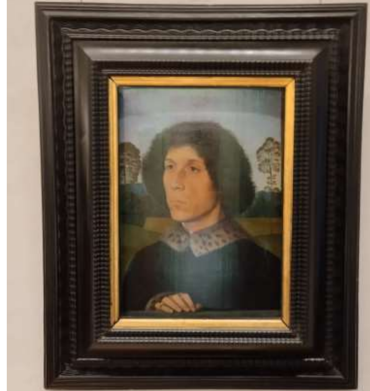
Hans Memling, Ritratto d'uomo , 1475 ca, Firenze, Galleria degli Uffizi