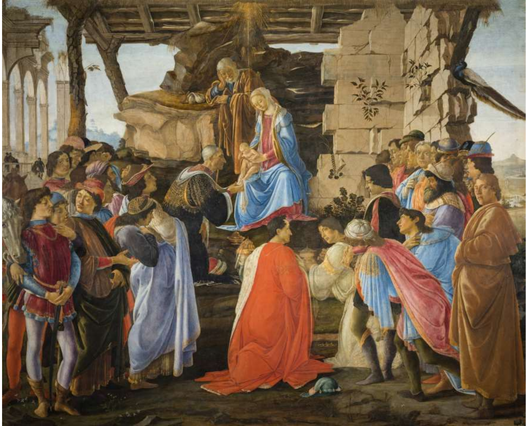
Sandro Botticelli, Adorazione dei Magi , 1470 - 75