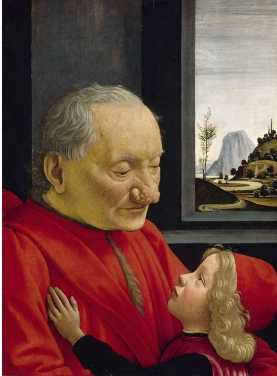
Domenico Ghirlandaio, Ritratto di nonno con nipote , 1490 ca