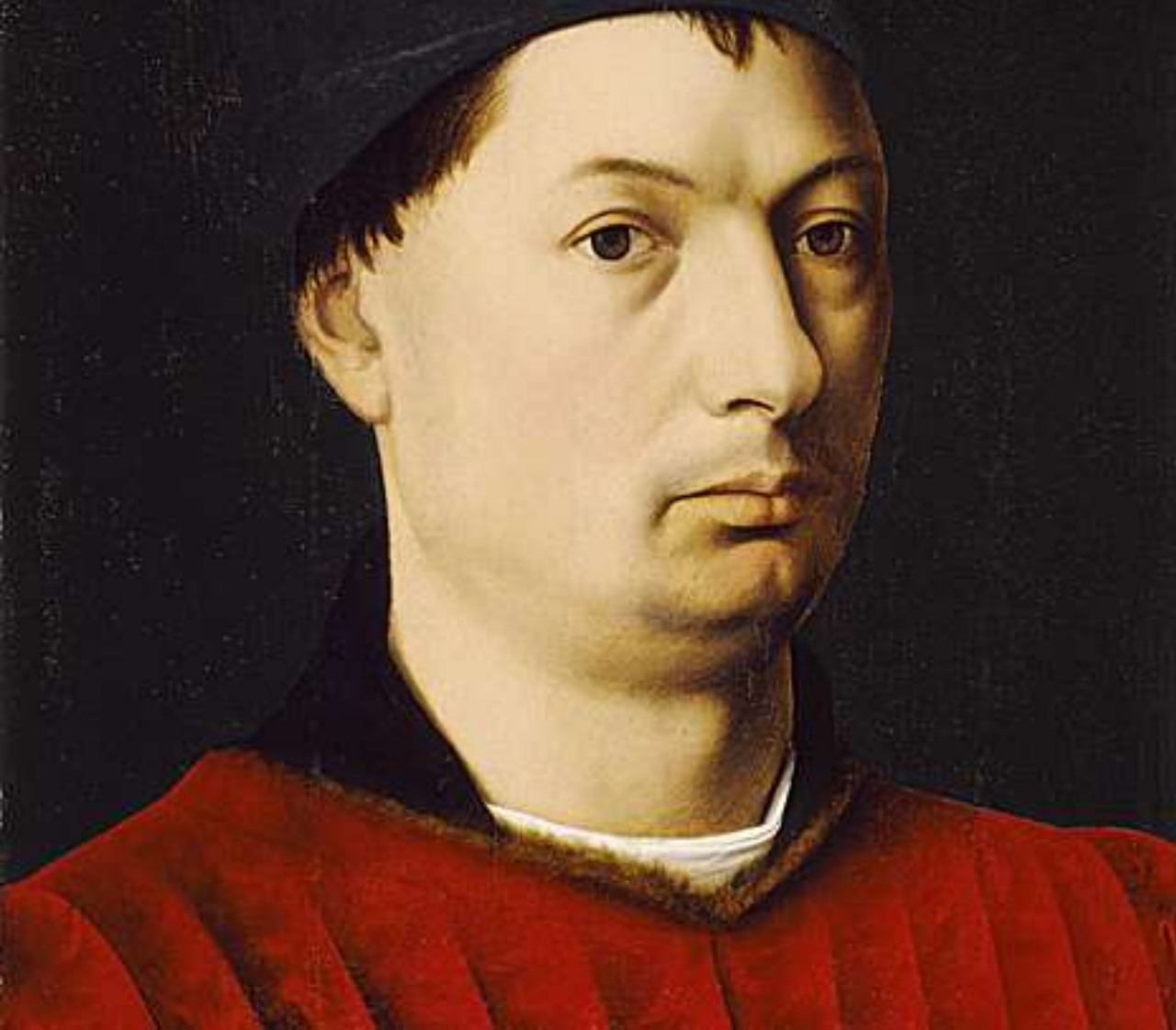
Petrus Christus, 1475 ca.