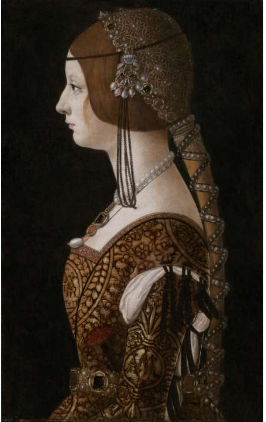
Ambrogio de Predis, Bianca Maria Sforza , 1493 Washington, National Gallery