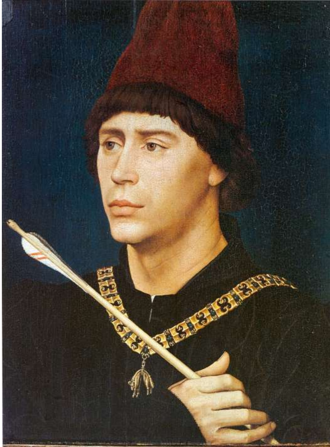
Rogier van der Weyden, Francesco d'Este Antoine de Bourgogne