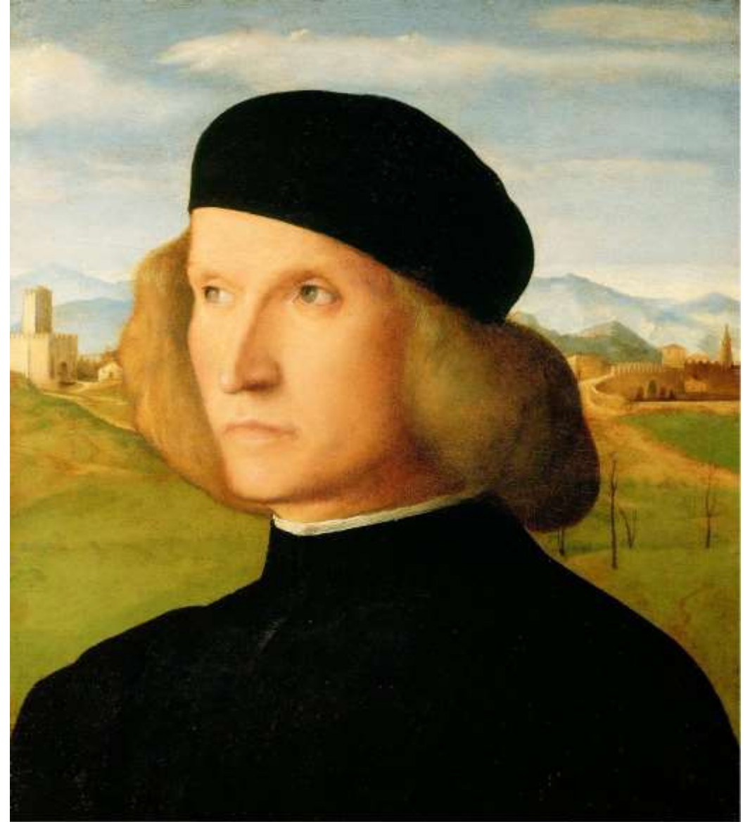
Ritratto di giovane uomo