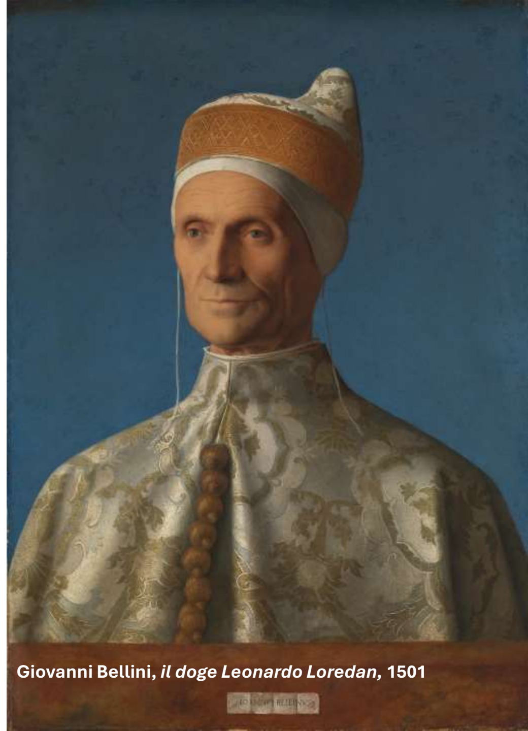
Giovanni Bellini, il doge Leonardo Loredan , 1501