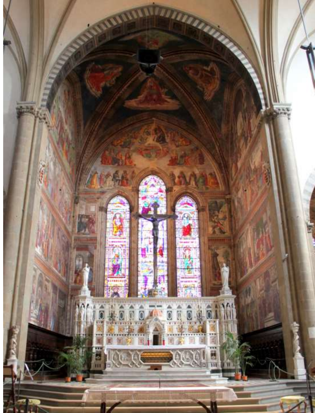
Firenze, Santa Maria novella, Cappella Tornabuoni, 1485