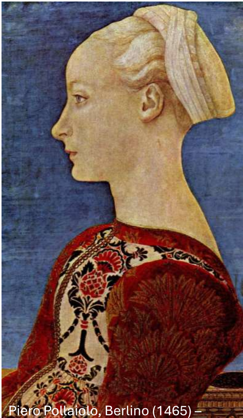
Piero Pollaiuolo, Berlino (1465) –