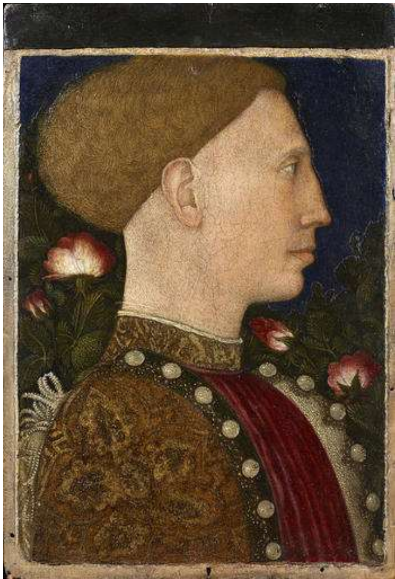
Leonello d'Este , Antonio di Puccio Pisano (Pisanello), 1441 tempera su tavola, Bergamo,