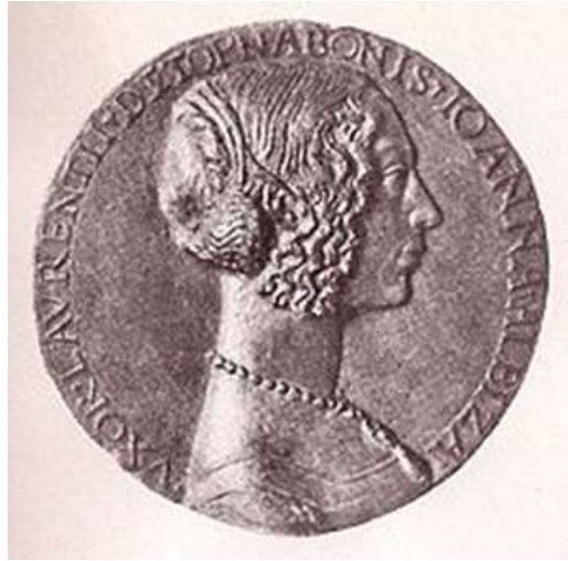
Niccolò di Forzore Spinelli, medaglia di Giovanna Tornabuoni