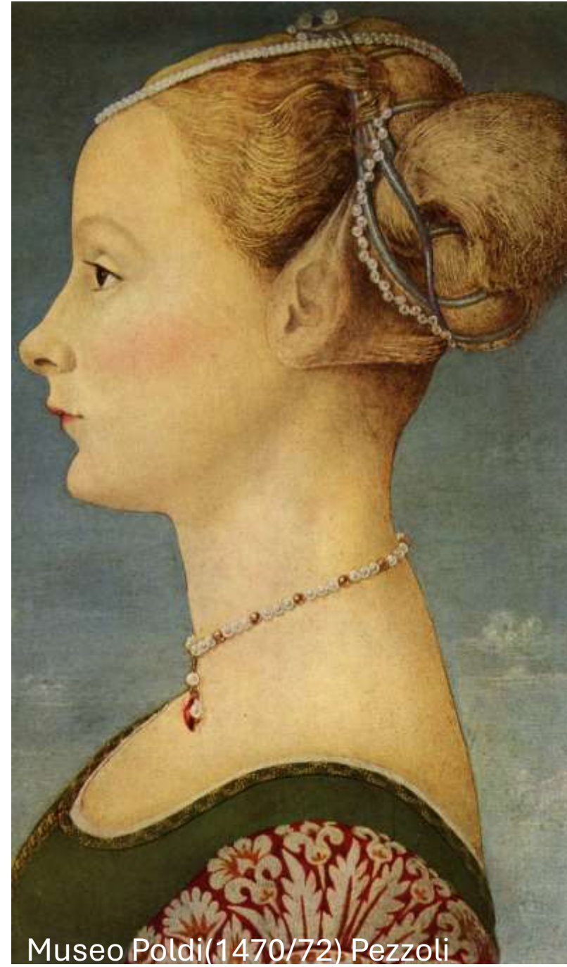
Museo Poldi (1470/72) Pezzoli