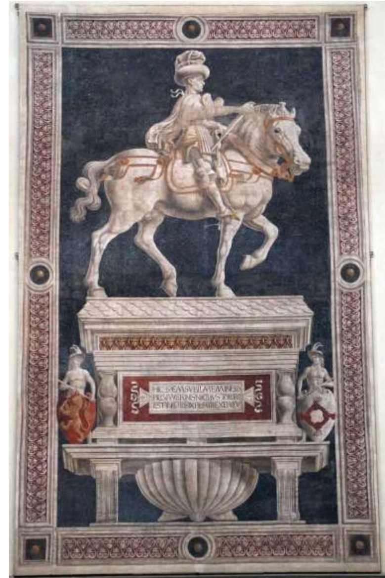
Andrea del Castagno, Ritratto equestre di Niccolò da Tolentino , 1456