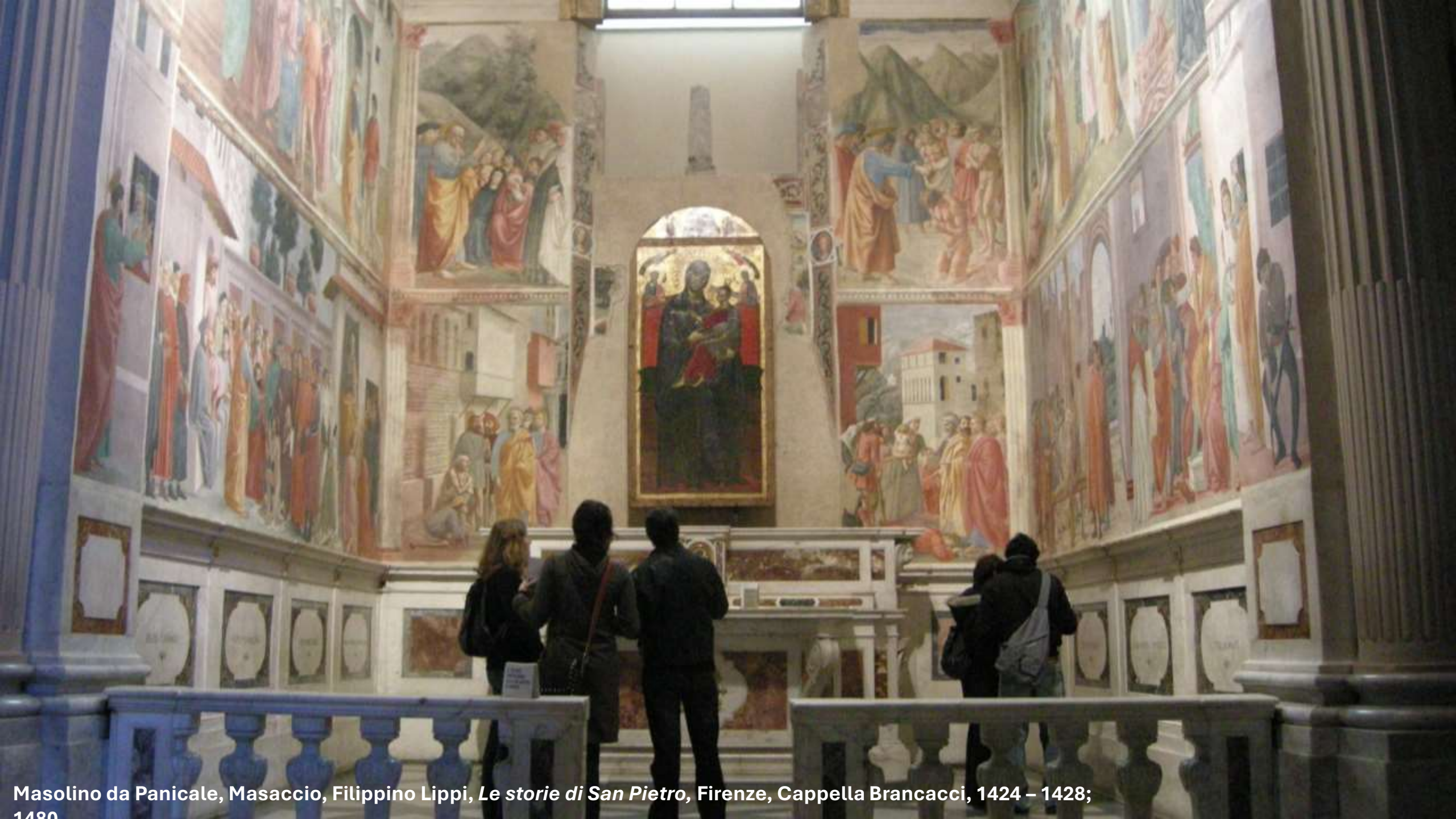
Masolino da Panicale, Masaccio, Filippino Lippi, Le storie di San Pietro , Firenze, Cappella Brancacci, 1424 – 1428; 1480