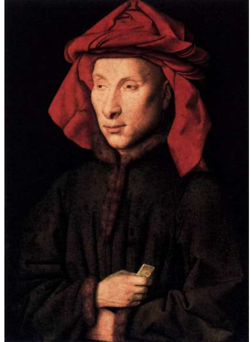
Giovanni Arnolfini , 1440, Berlino Gemäldegalerie