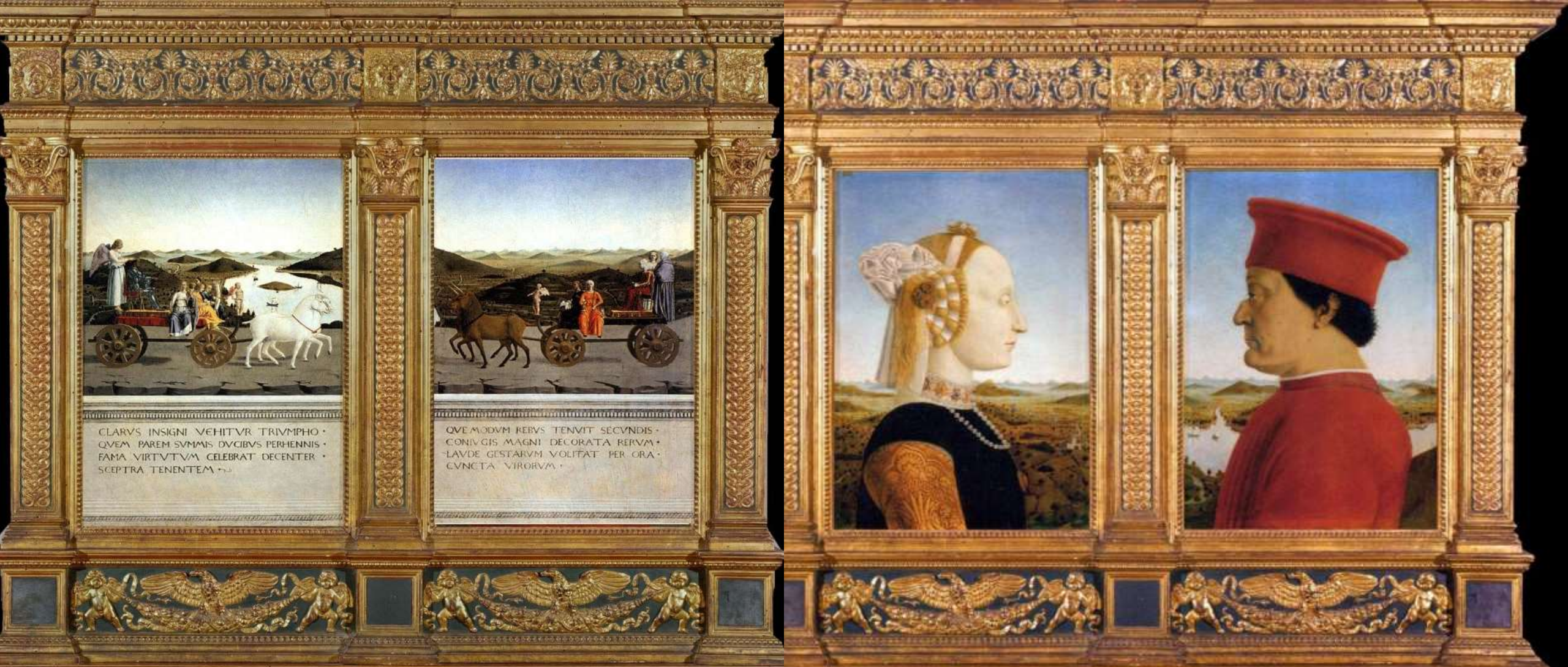
Federico di Montefeltro e Battista Sforza , dittico, Piero Della Francesca, 1473-75, olio su tavola di pioppo, Firenze, Galleria degli Uffizi