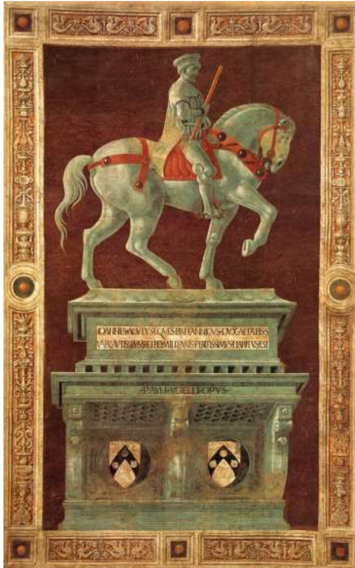
Paolo Uccello, Ritratto equestre di Giovanni Acuto , 1436