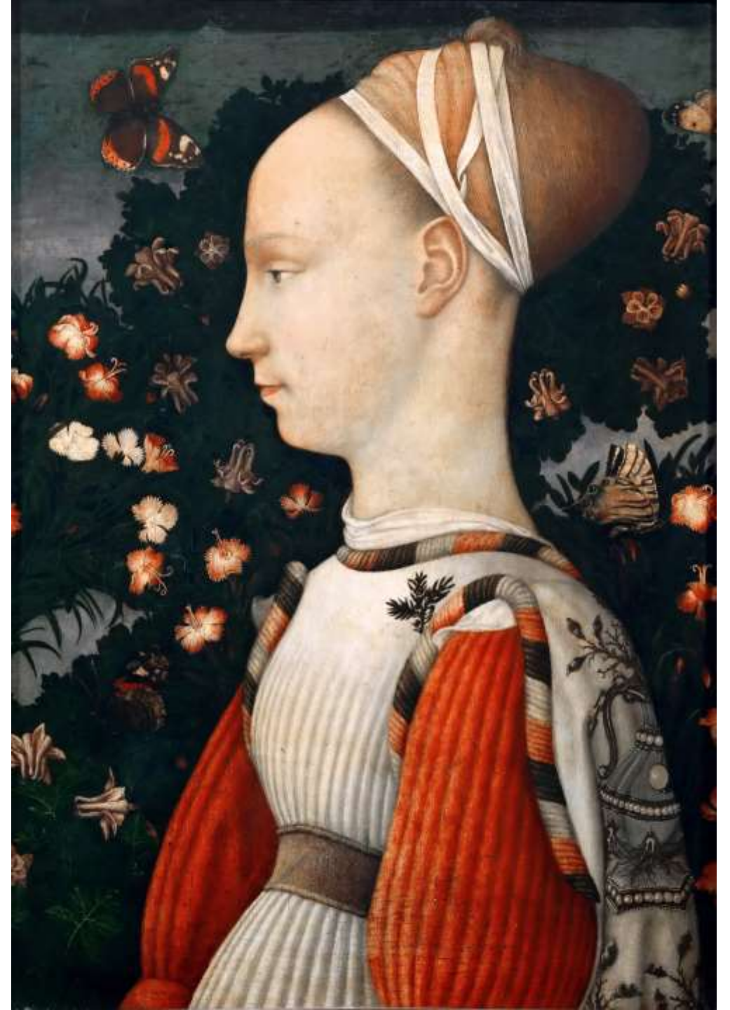
Pisanello, Ritratto di principessa estense , 1435-45 Parigi, Musée du Louvre