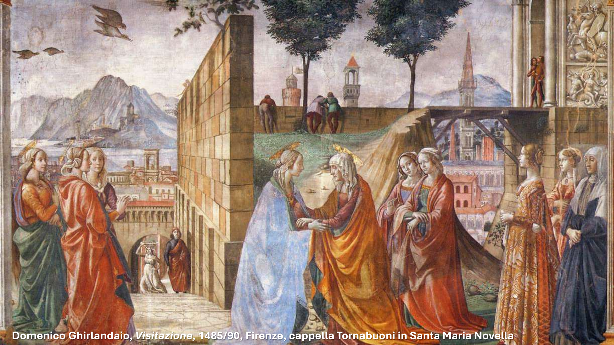
Domenico Ghirlandaio, Visitazione , 1485/90, Firenze, cappella Tornabuoni in Santa Maria Novella