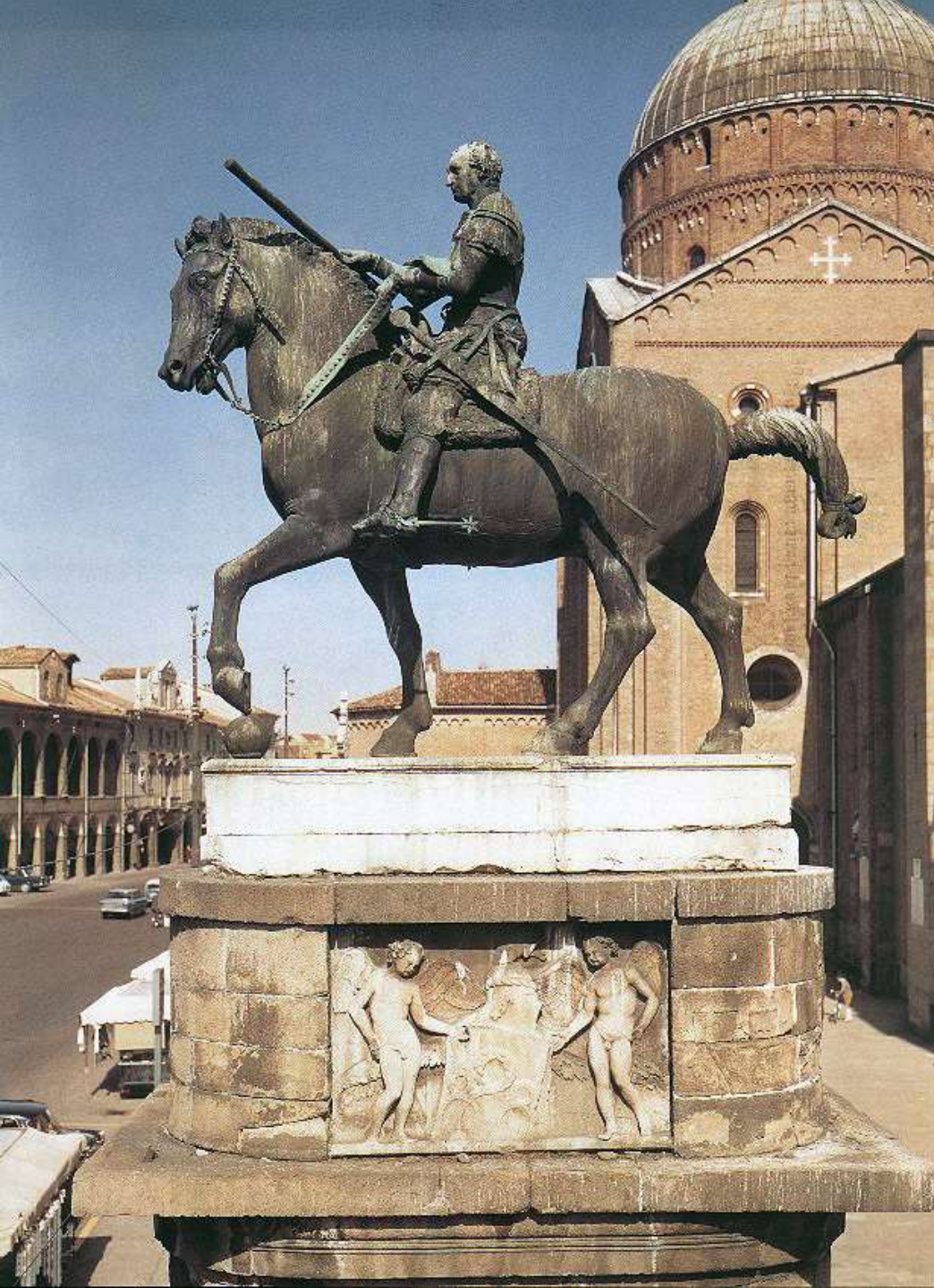
Donatello, Monumento equestre del Gattamelata , 1446 – 1453, Padova