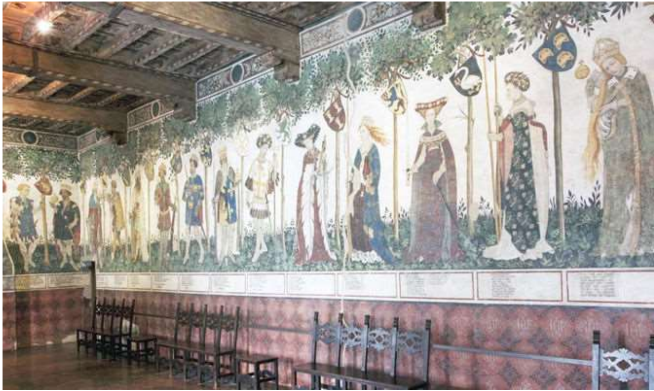
Castello della Manta (CN), 1420 ca