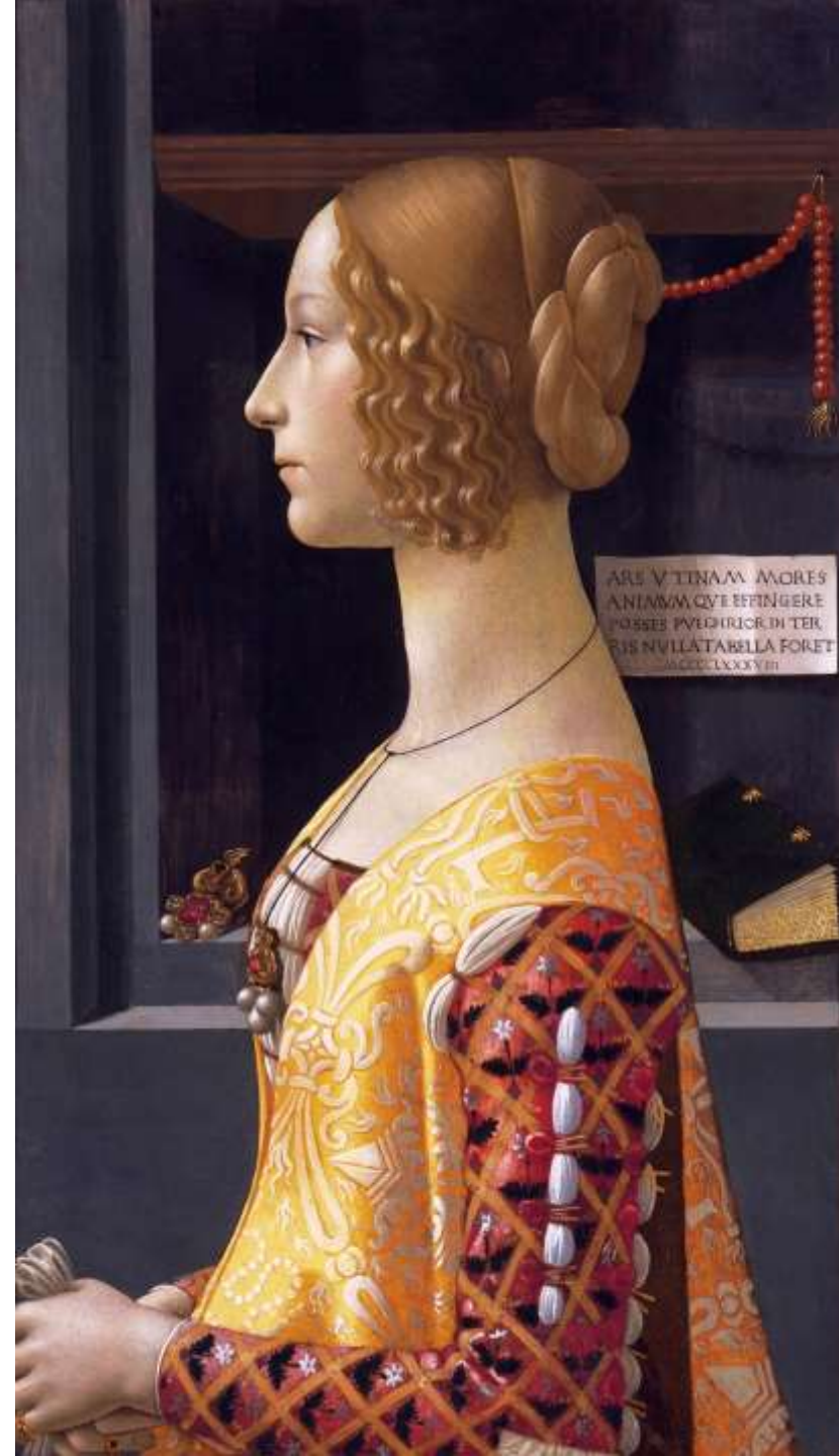
Domenico Ghirlandaio, Giovanna degli Albizzi Tornabuoni , 1488 Madrid, Museo Thyssen-Bornemisza