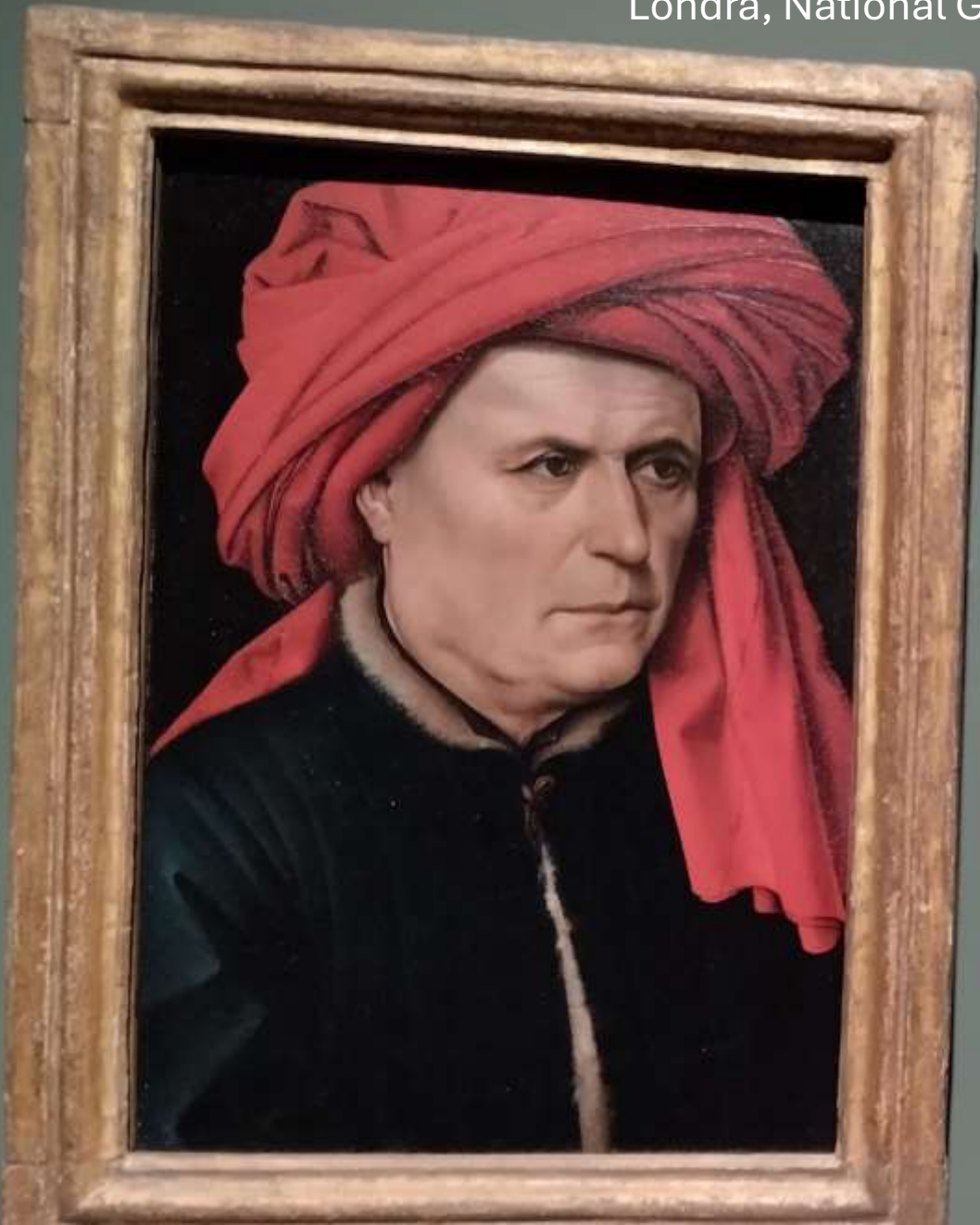
Ritratto di uomo e di donna , dittico, Robert Campin, 1435 ca. Londra, National Gallery