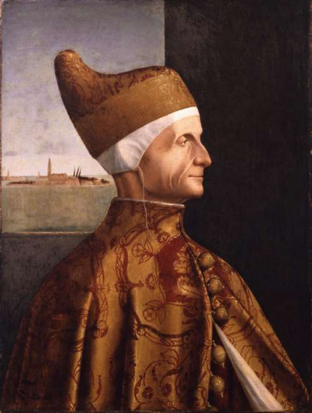
Vittore Carpaccio (?), il doge Leonardo Loredan , 1501 - 1503