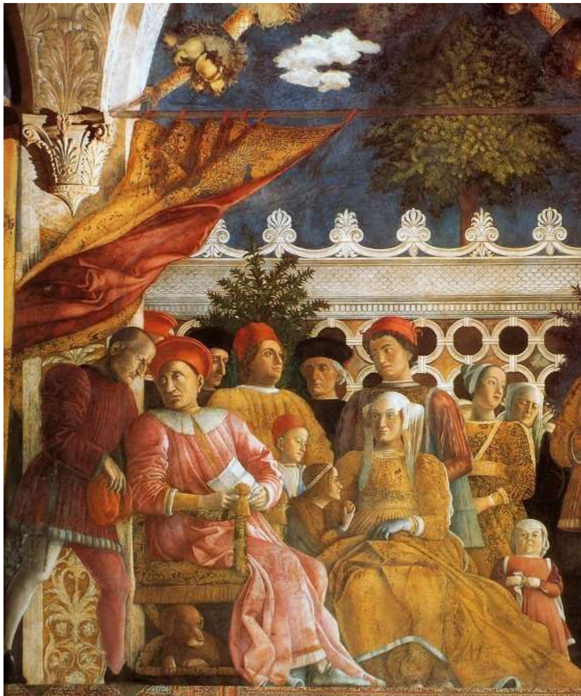
Andrea Mantegna, La corte , Camera degli sposi, 1465 - 1474