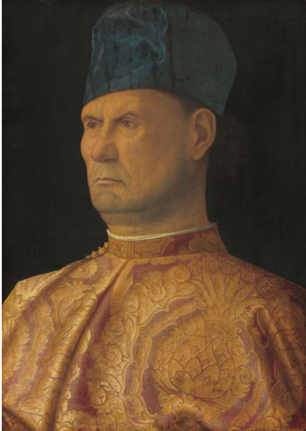
Giovanni Bellini, Ritratto di Giovanni Emo , ante 1483