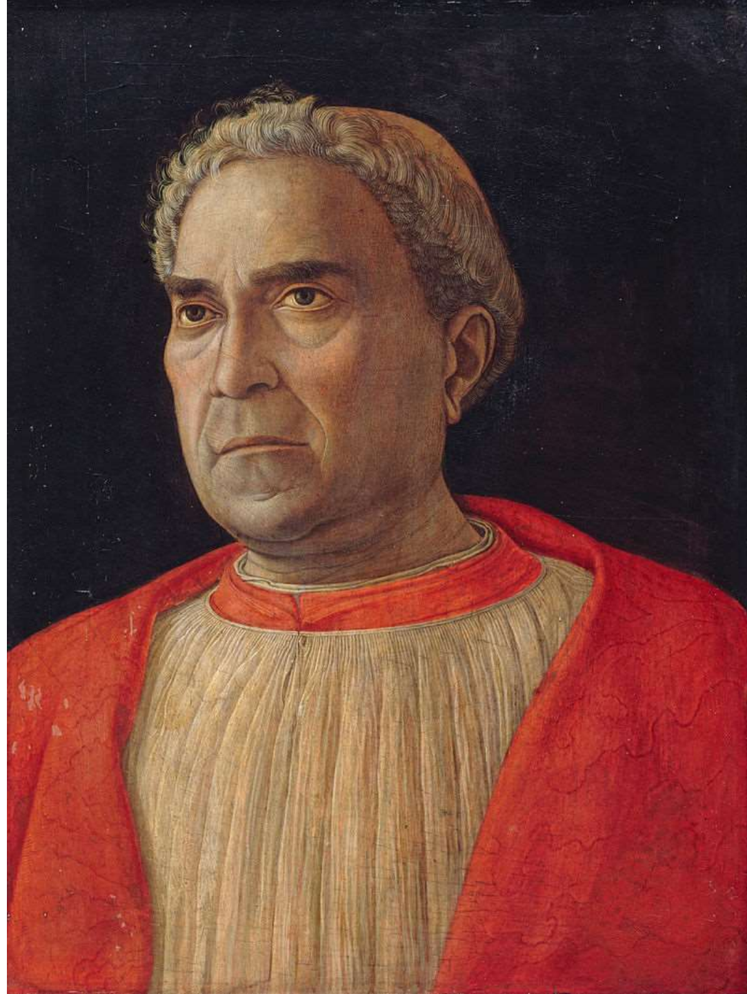
Andrea Mantegna, Il cardinale Ludovico Trevisan Berlino, Gemäldegalerie