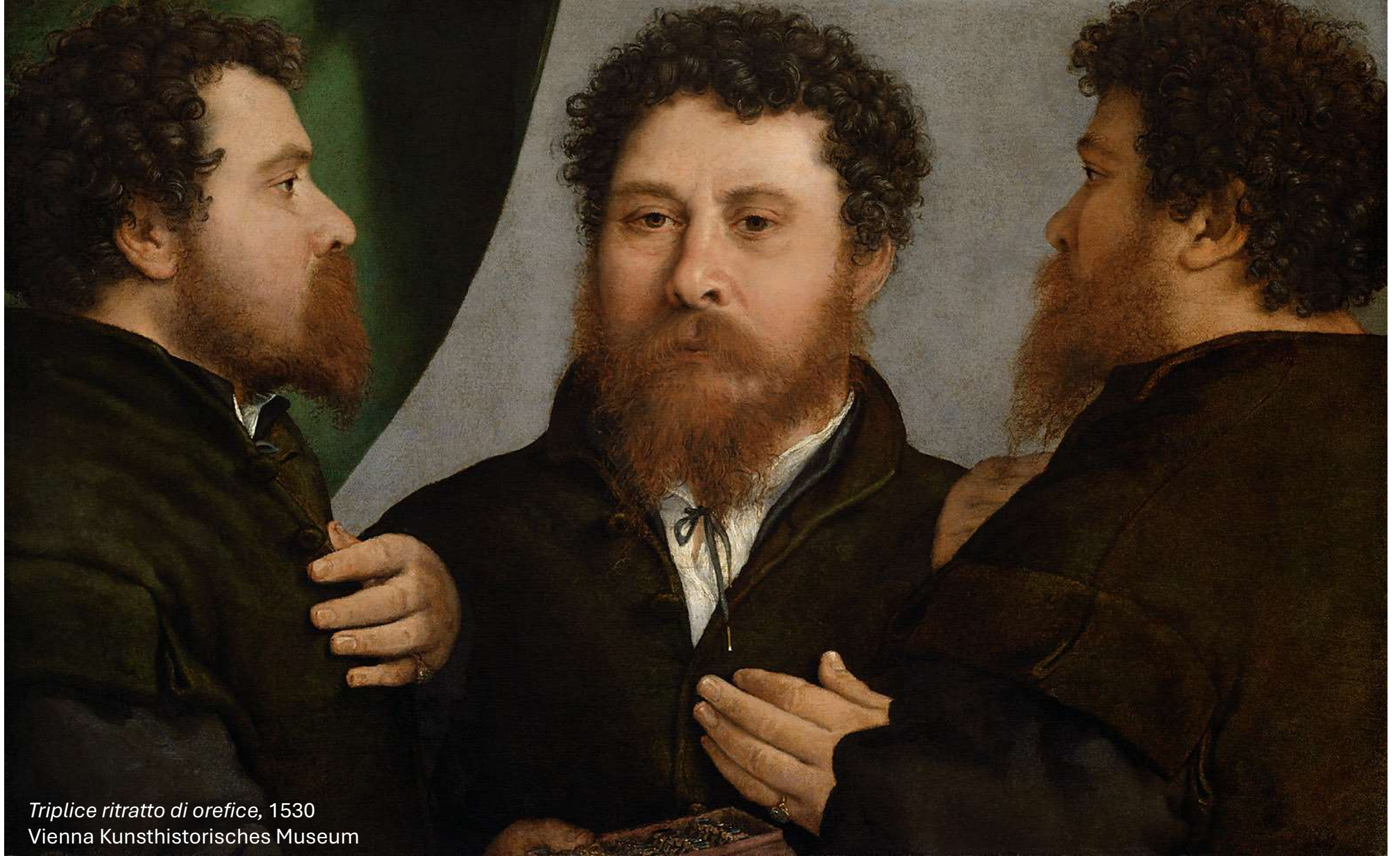
Triplice ritratto di orefice , 1530 Vienna Kunsthistorisches Museum