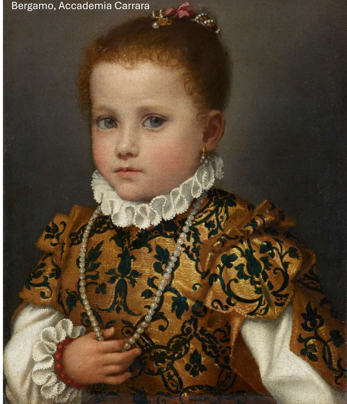
Bambina di casa Redetti , 1570-73 Bergamo, Accademia Carrara