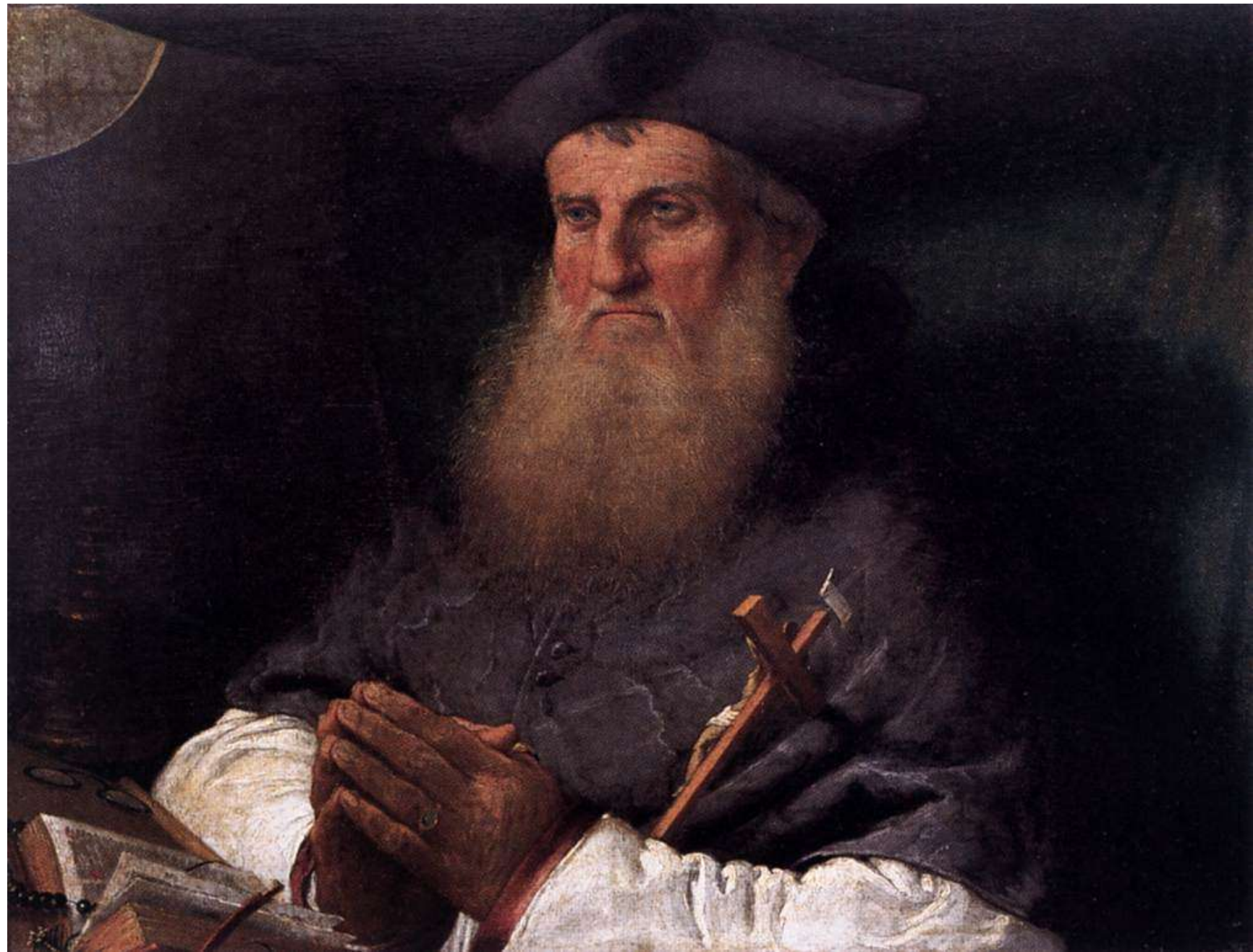
Il vescovo Tommaso Negri, 1527 Spalato, Museo francescano di Pokuìjud