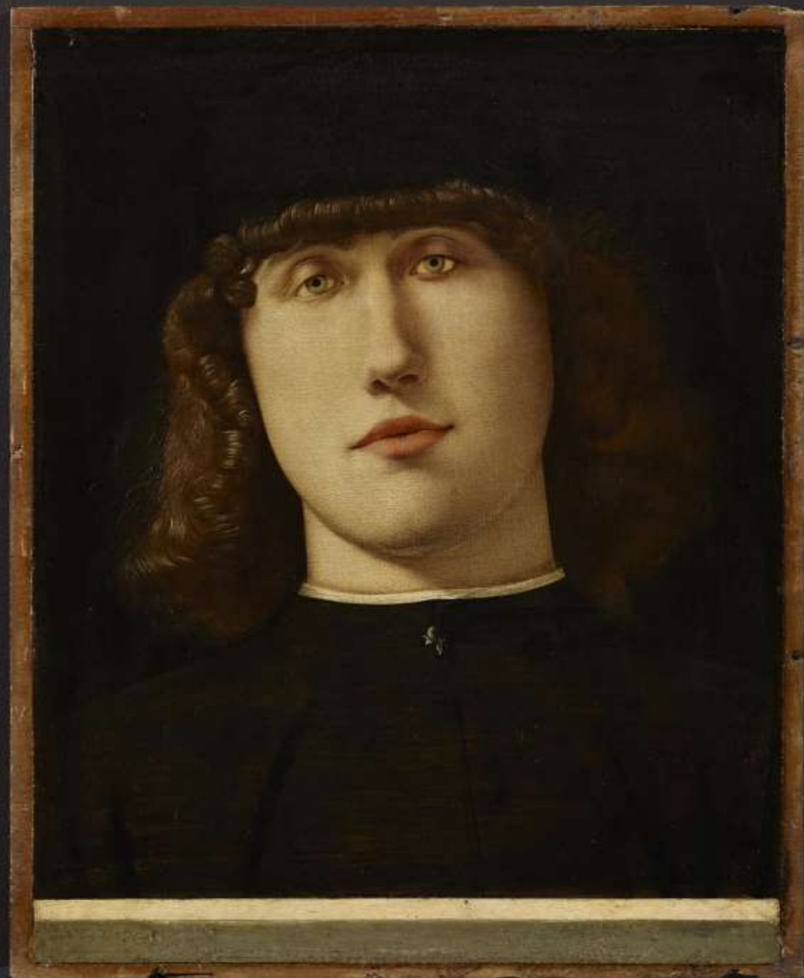
Ritratto di giovane , olio su tavola, 1498/1500 Bergamo, Accademia Carrara