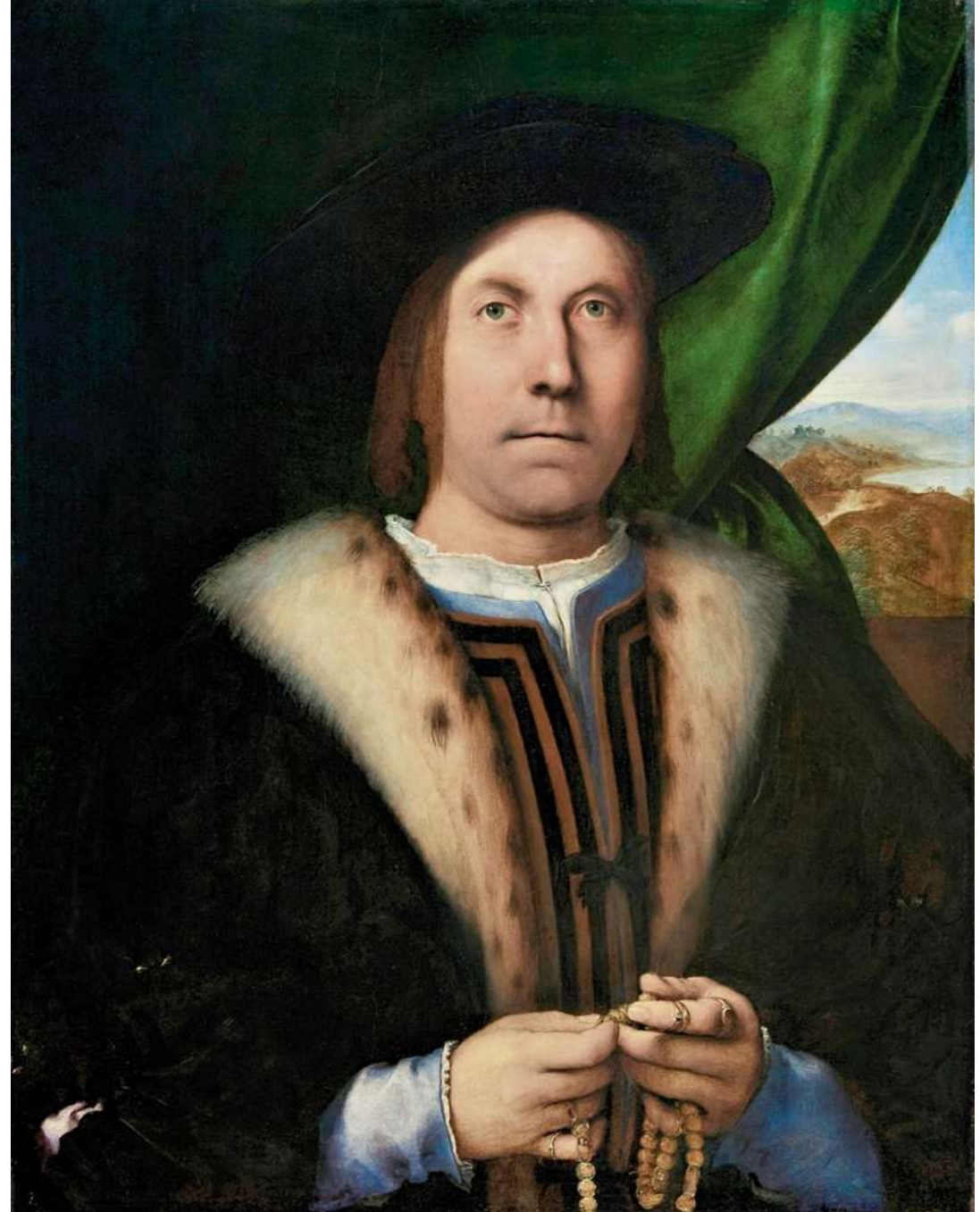
Ritratto d'uomo con rosario , 1515, Nivaagaard Collection