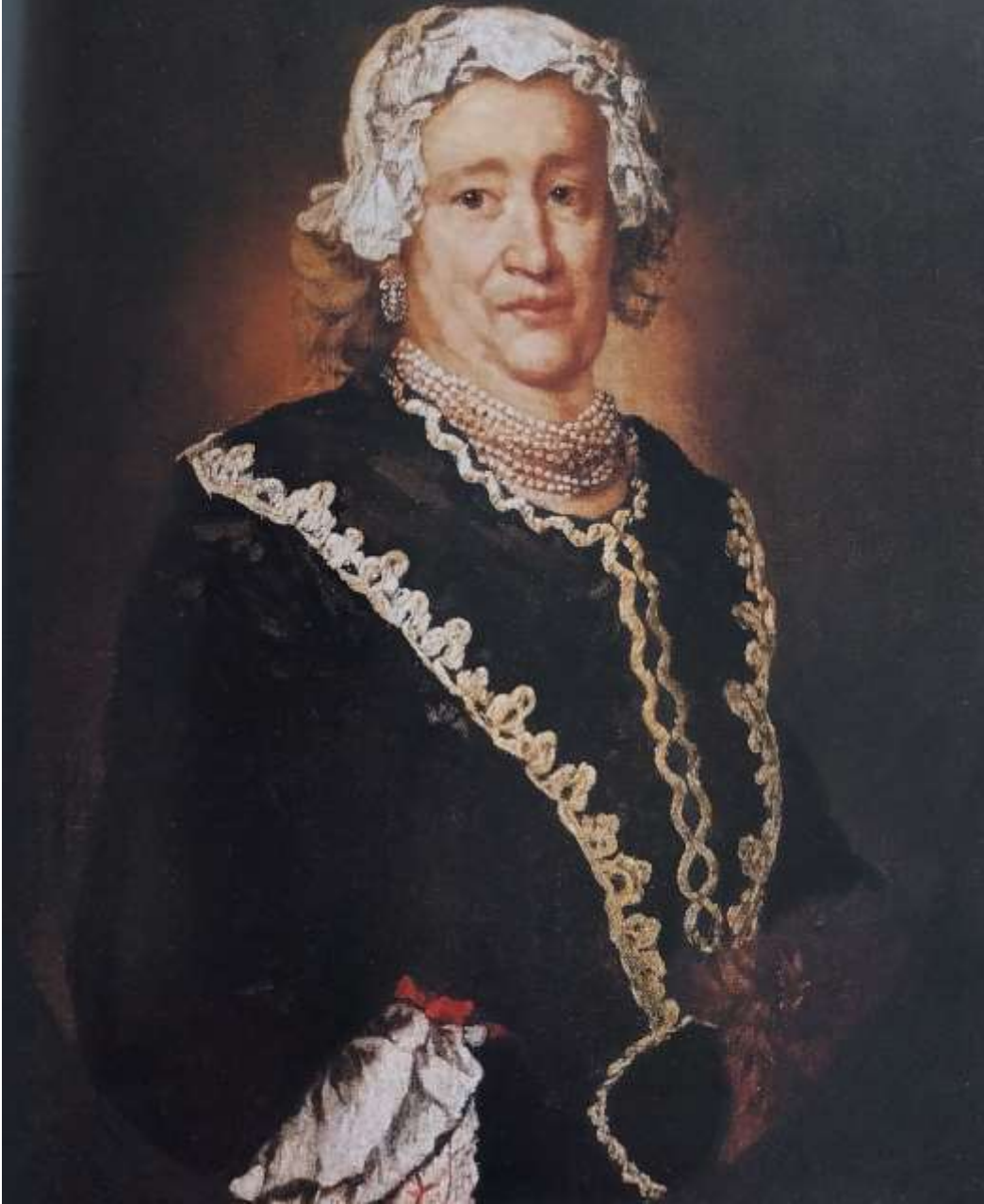
Bertrama Daina de' Valsecchi, 1735 Bergamo Accademia Carrara