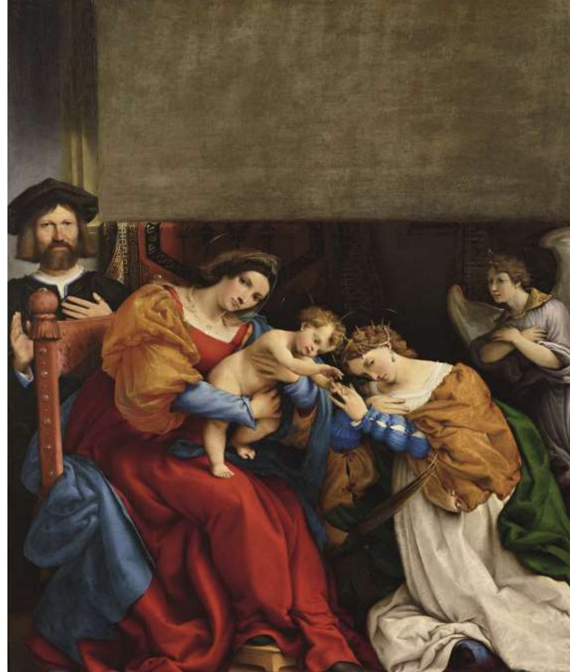
Matrimonio mistico di Santa Caterina, olio su tela, 1523 Bergamo, Accademia Carrara