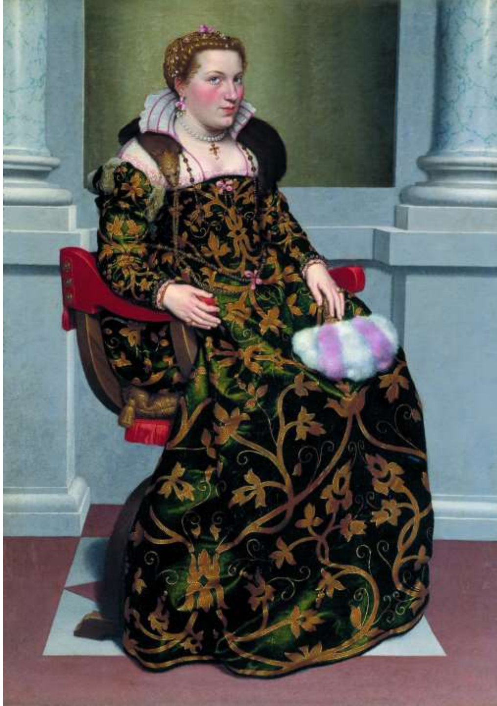
Isotta Brembati, 1552-53 Bergamo, Palazzo Moroni