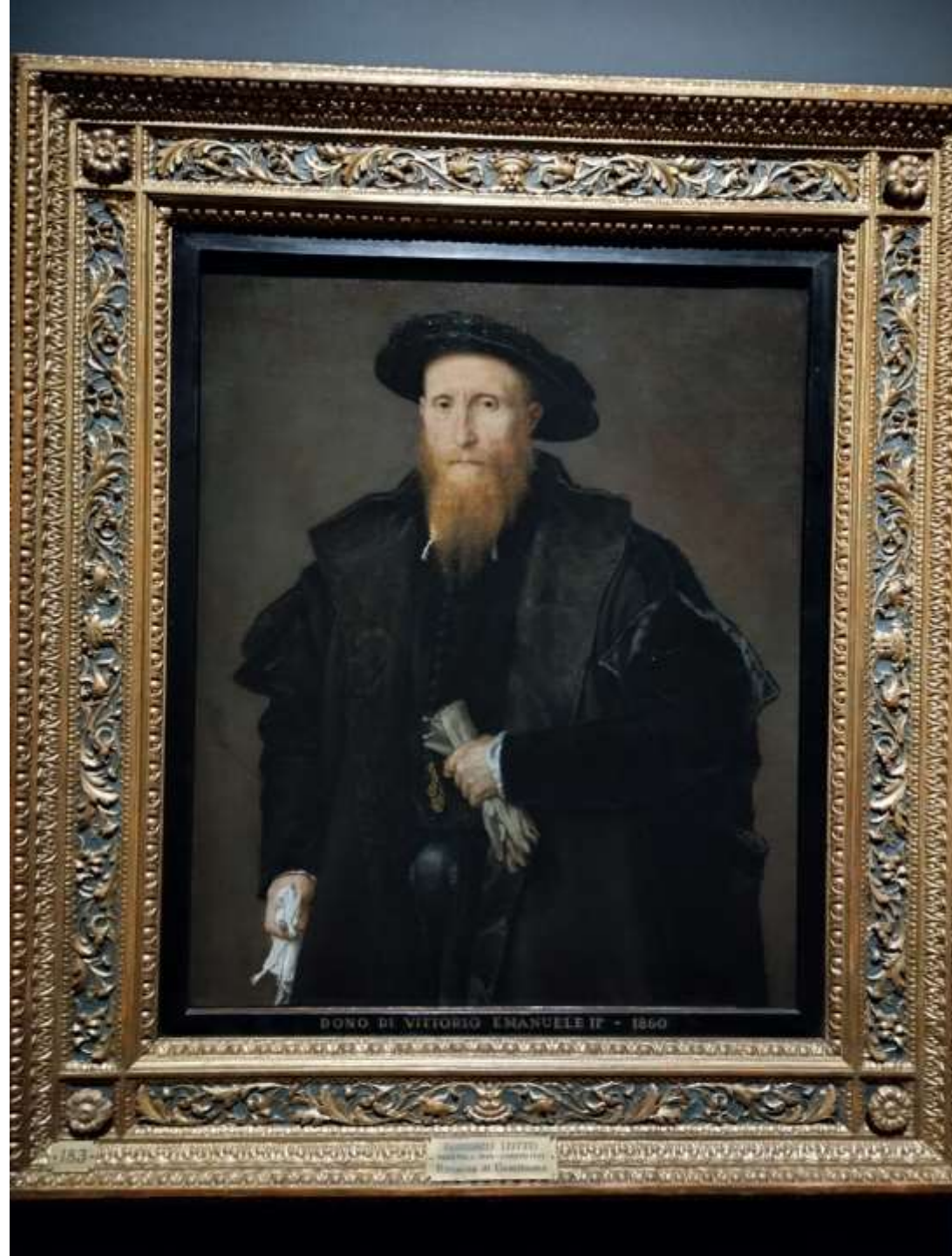
Uomo con guanti e fazzoletto , 1543 Milano, Pinacoteca di Brera