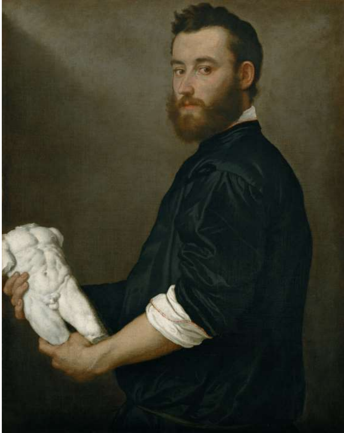
Alessandro Vittoria, 1551-52 Vienna, Kunsthistorisches Museum