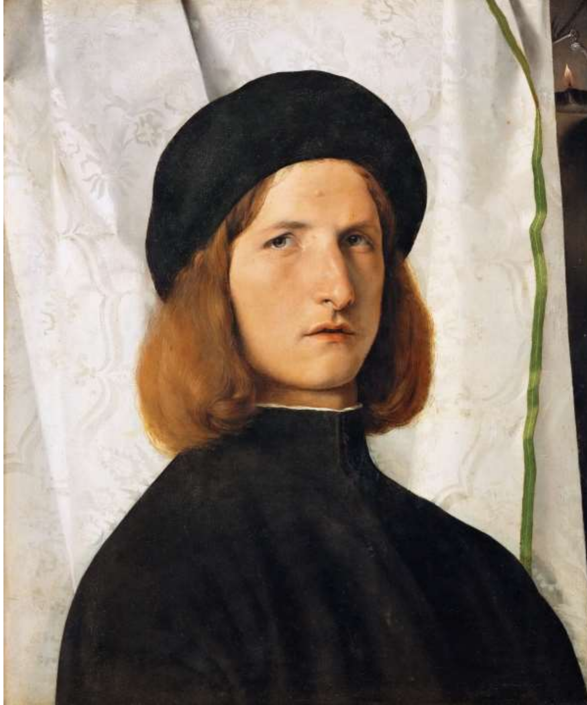
Ritratto di giovane con lucerna, Olio su tavola, 1506 Vienna, Kunsthistorisches Museum