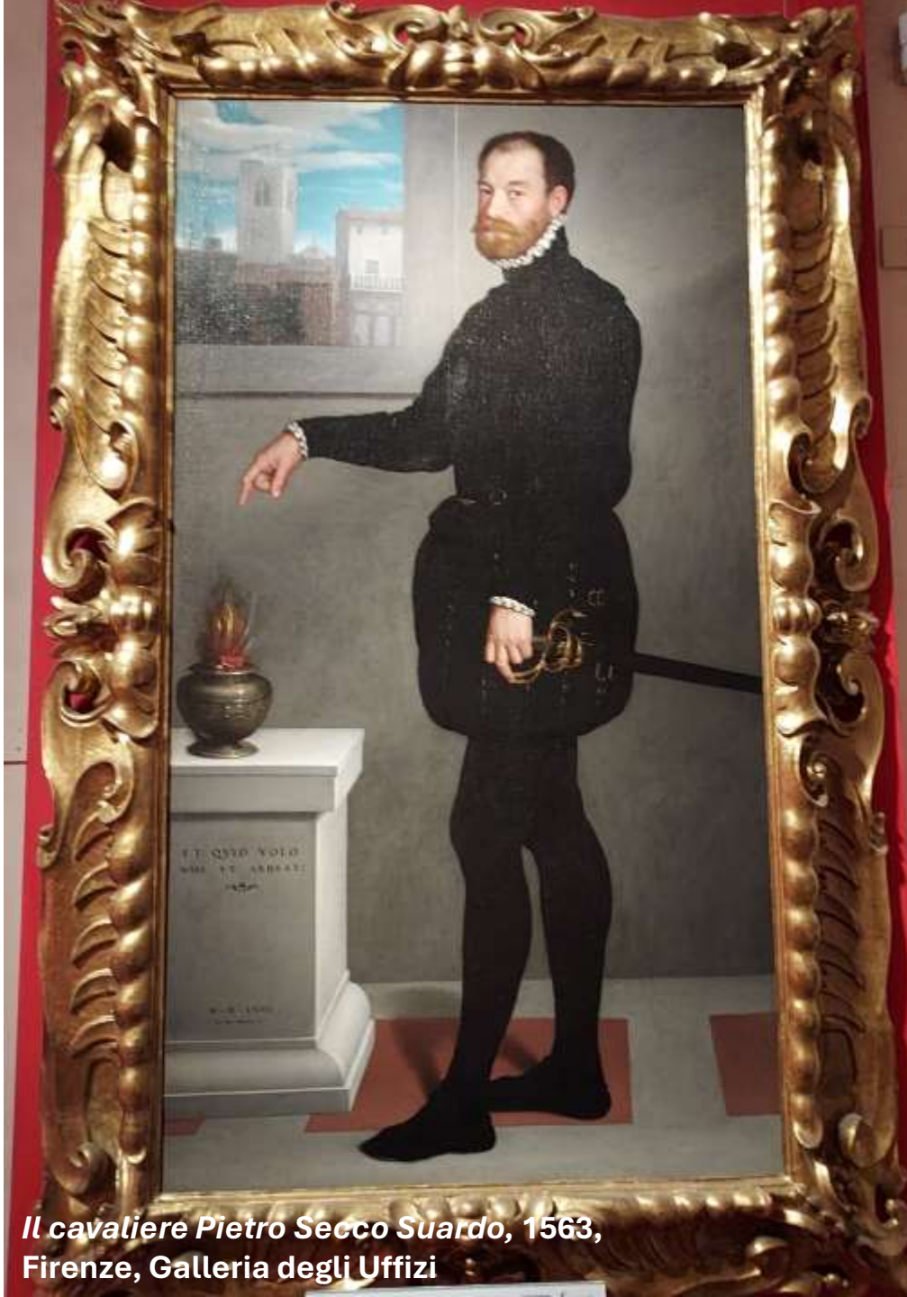
Il cavaliere Pietro Secco Suardo, 1563, Firenze, Galleria degli Uffizi