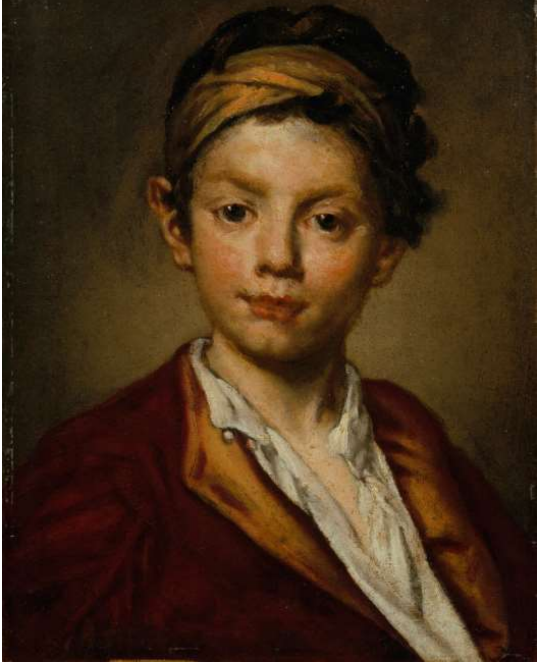
Ritratto di fanciullo, 1730