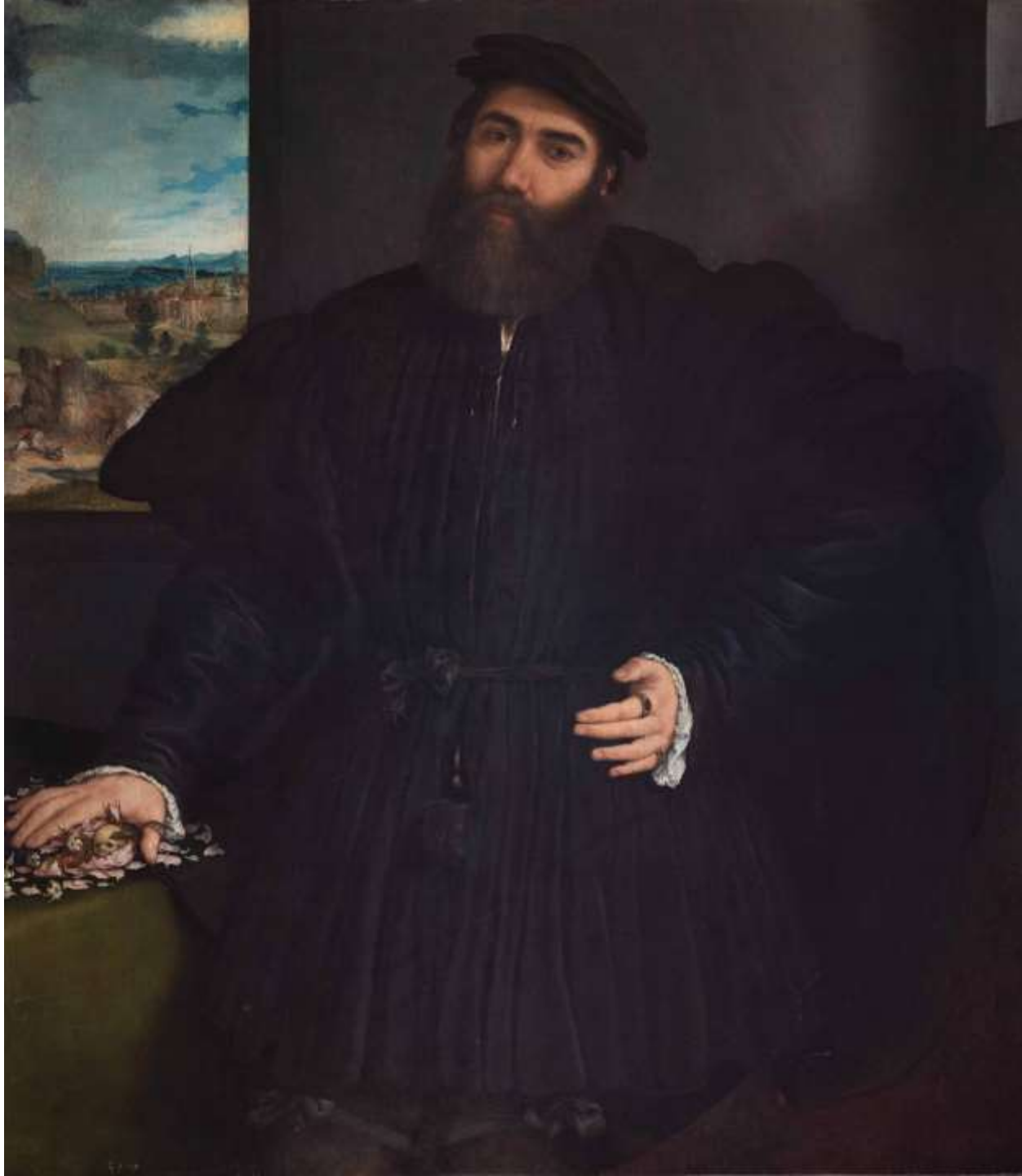
Ritratto di gentiluomo (Mercurio Bua?), 1530 Roma, Galleria Borghese