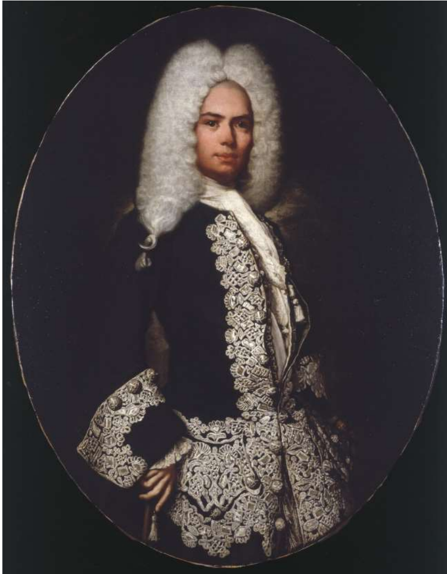
Il conte Flaminio Tassi (?), 1720-25 Milano, Pinacoteca di Brera