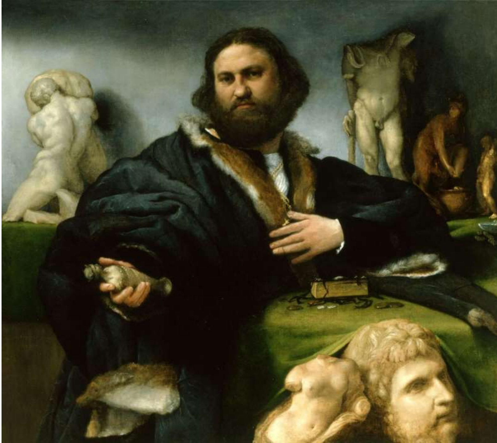
Andrea Odoni, olio su tela, 1527 Londra, Royal Collection di Buckingham Palace