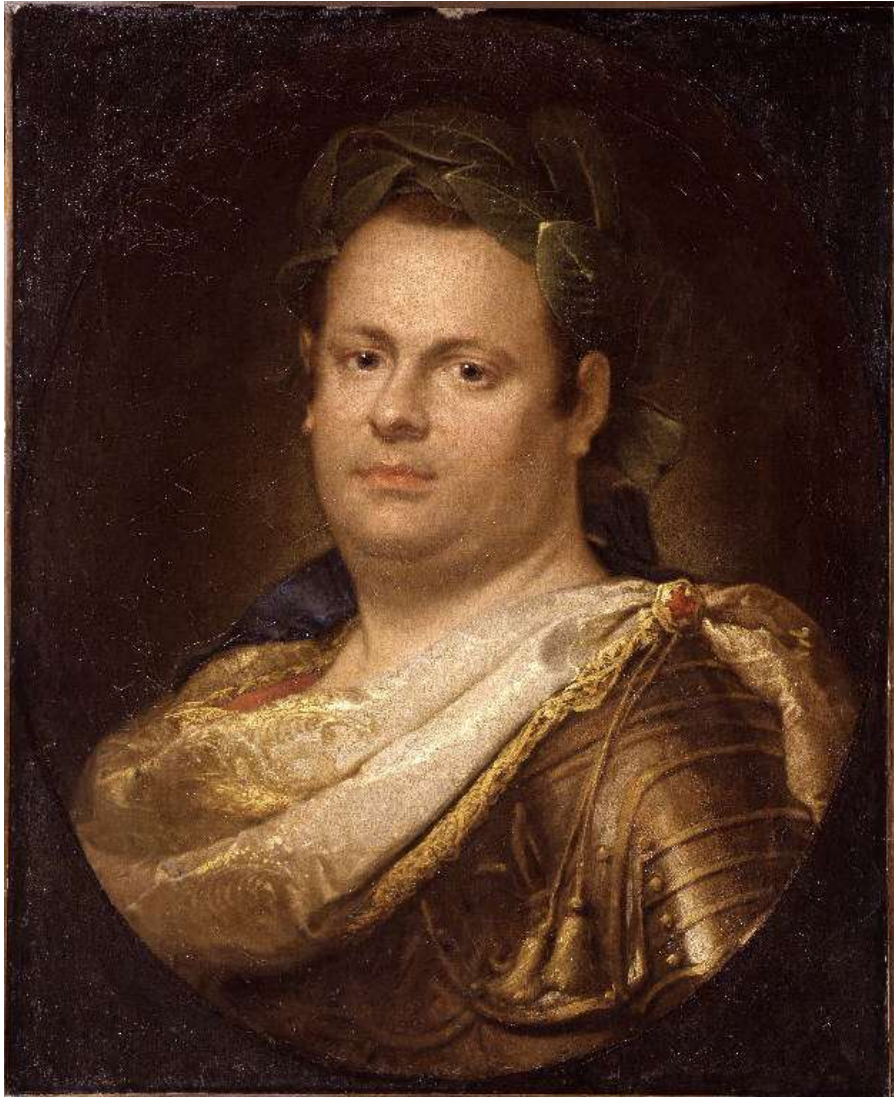
L'imperatore Vitellio , 1702, Bergamo Accademia Carrara Poeta laureato , 1702, Bergamo Accademia Carrara