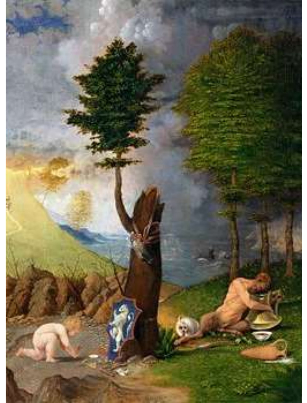
Allegoria del vizio e della virtù olio su tavola, 1505 Washington, National Gallery of Art