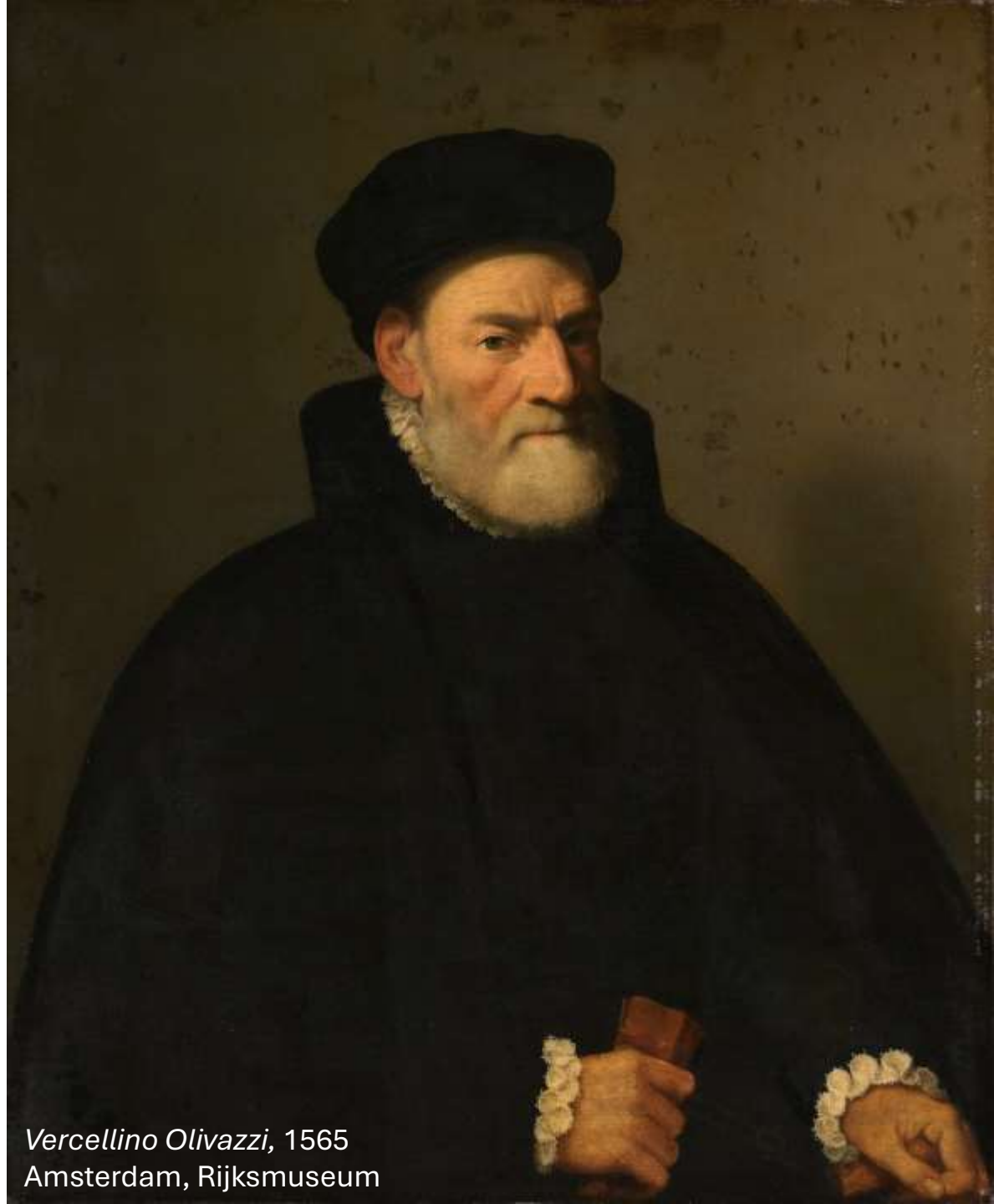
Vercellino Olivazzi, 1565 Amsterdam, Rijksmuseum