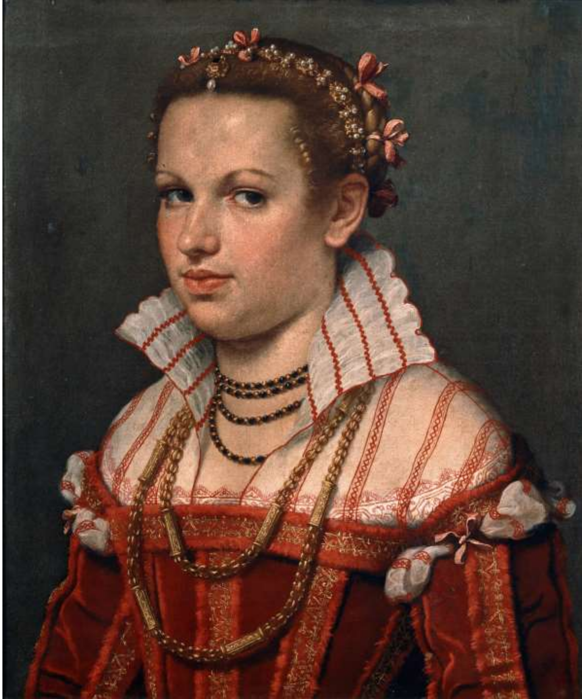
Isotta Brembati, 1549 Bergamo, Accademia Carrara