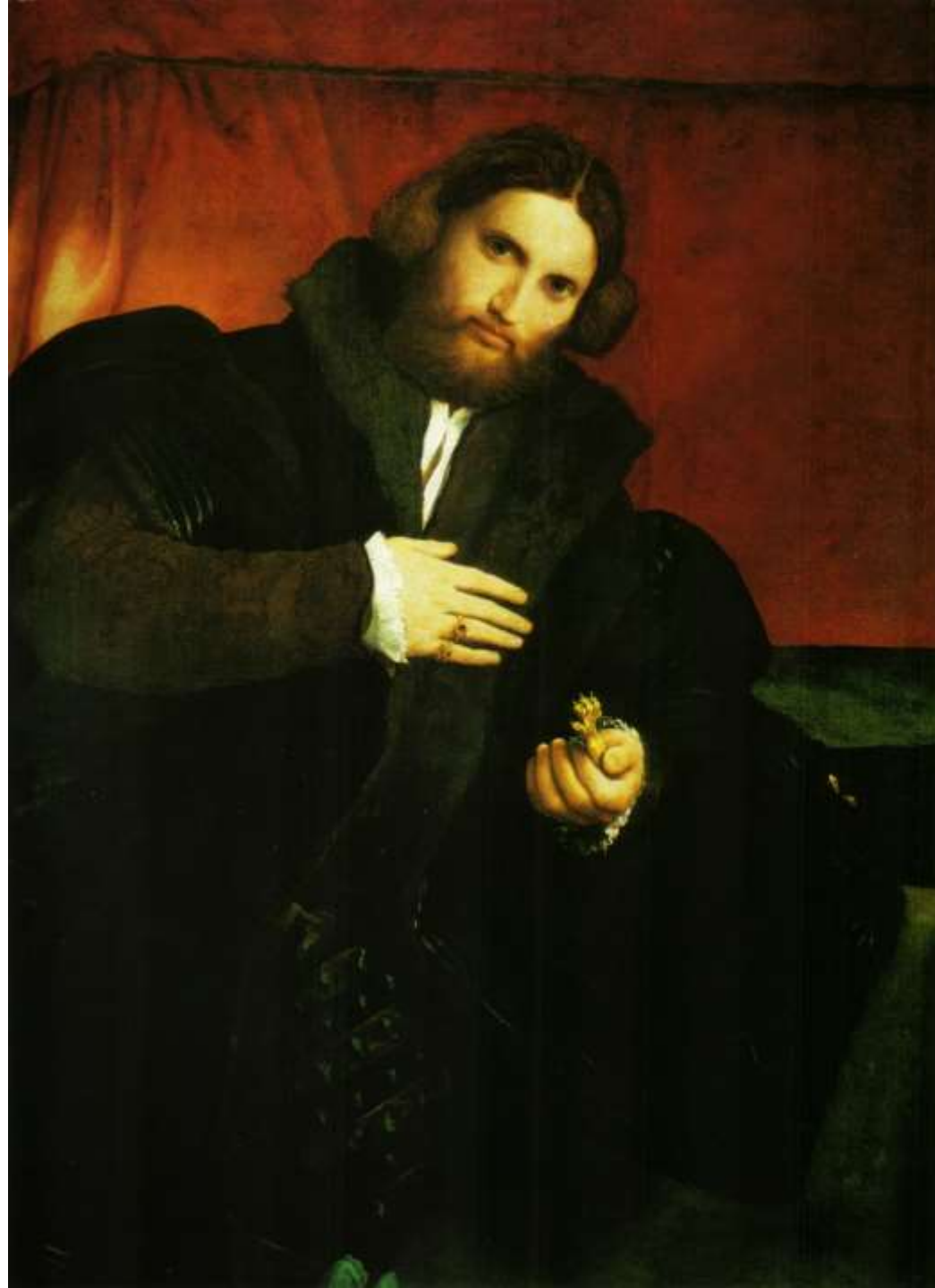
Ritratto di uomo con zampino di leone, 1525 Vienna, Kunsthistorisches Museum