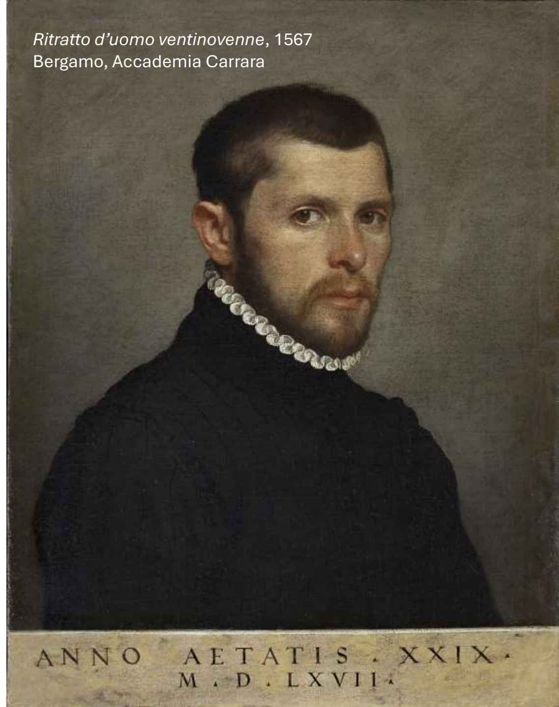
Ritratto d'uomo ventinovenne, 1567 Bergamo, Accademia Carrara