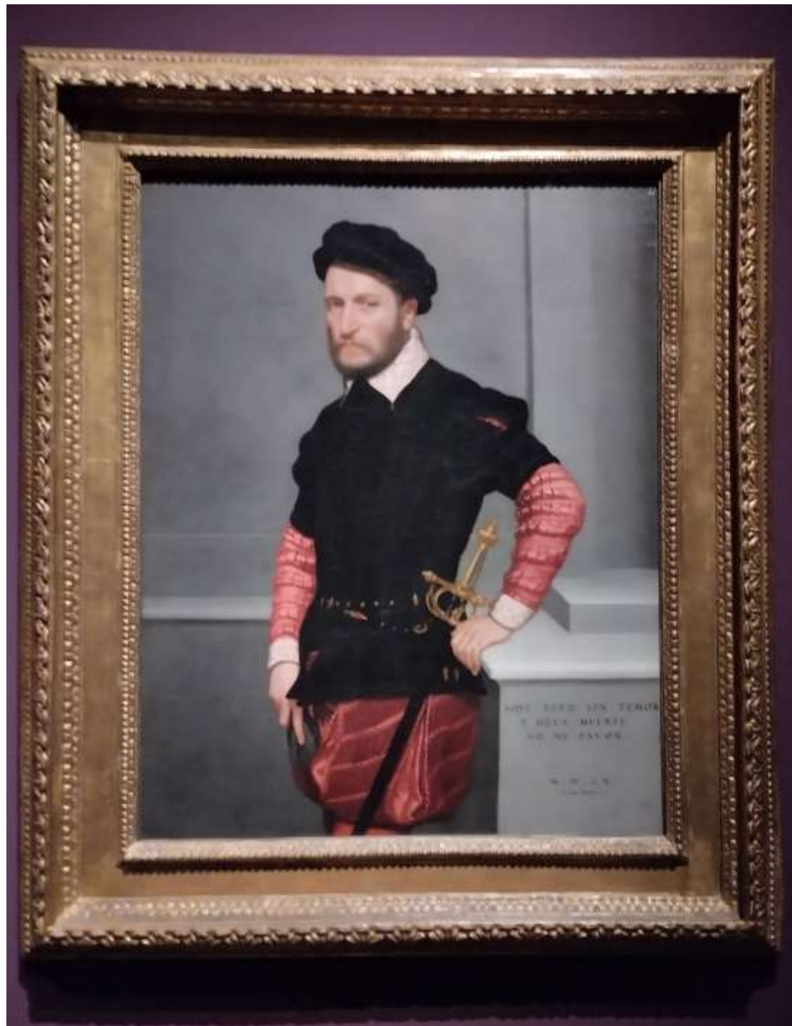
Don Gabriel de la Cueva y Giron, 1560 Berlino, Staatliche Museen