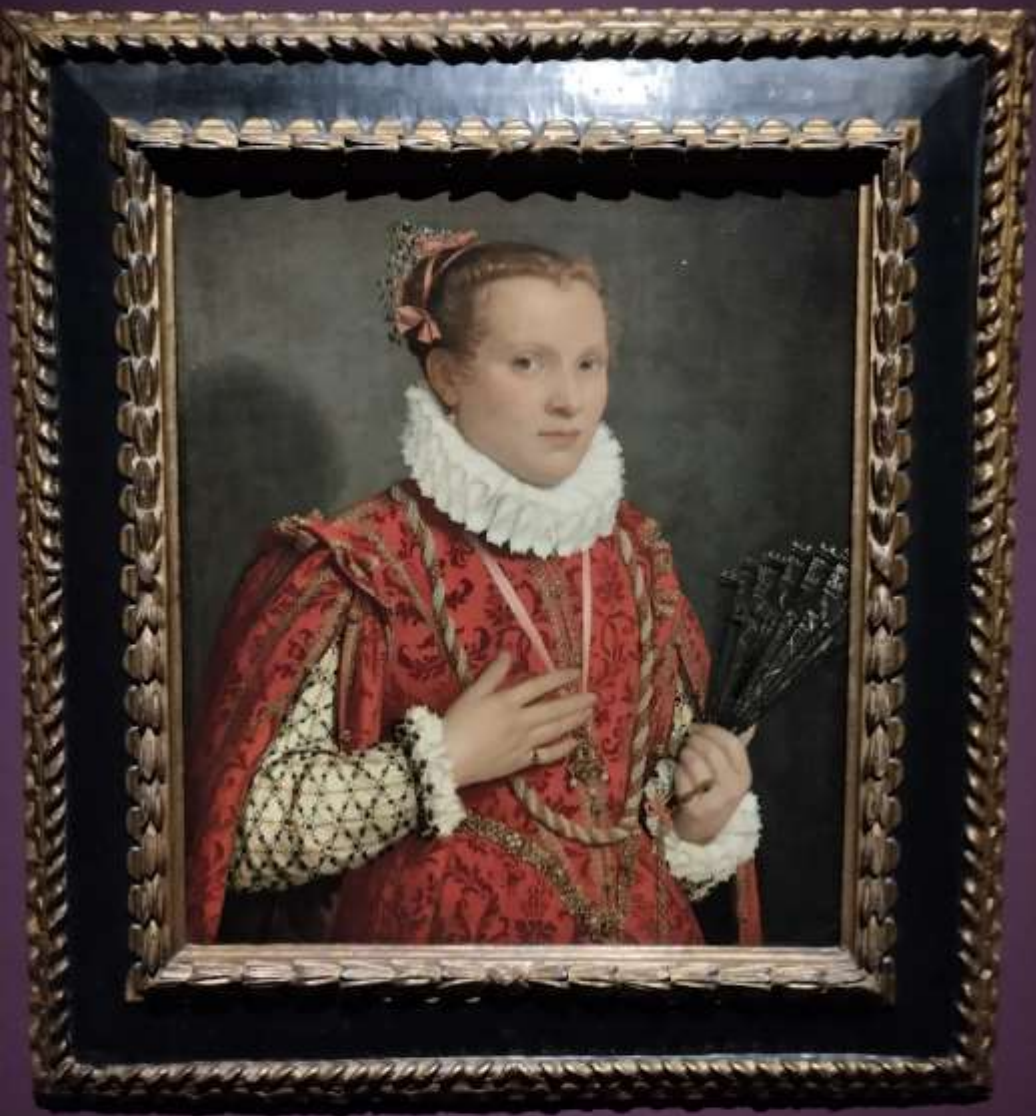
Dama con ventaglio , 1570 Amsterdam Rijksmuseum