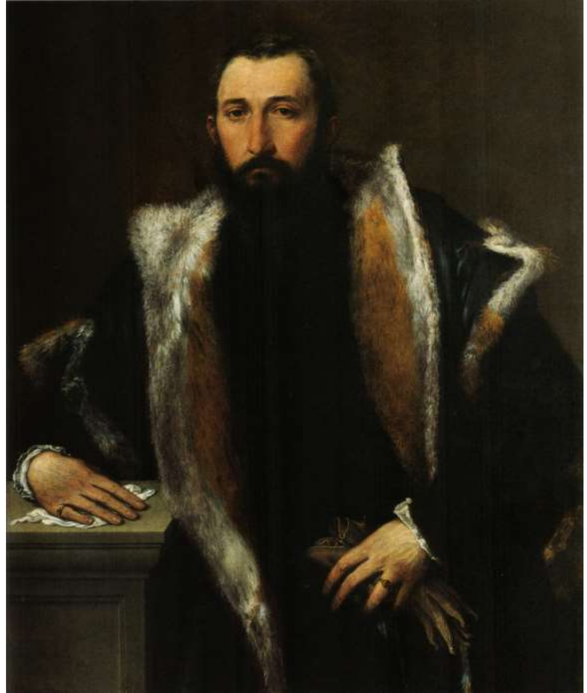
Ritratto di Febo Bettignoli da Brescia , 1543