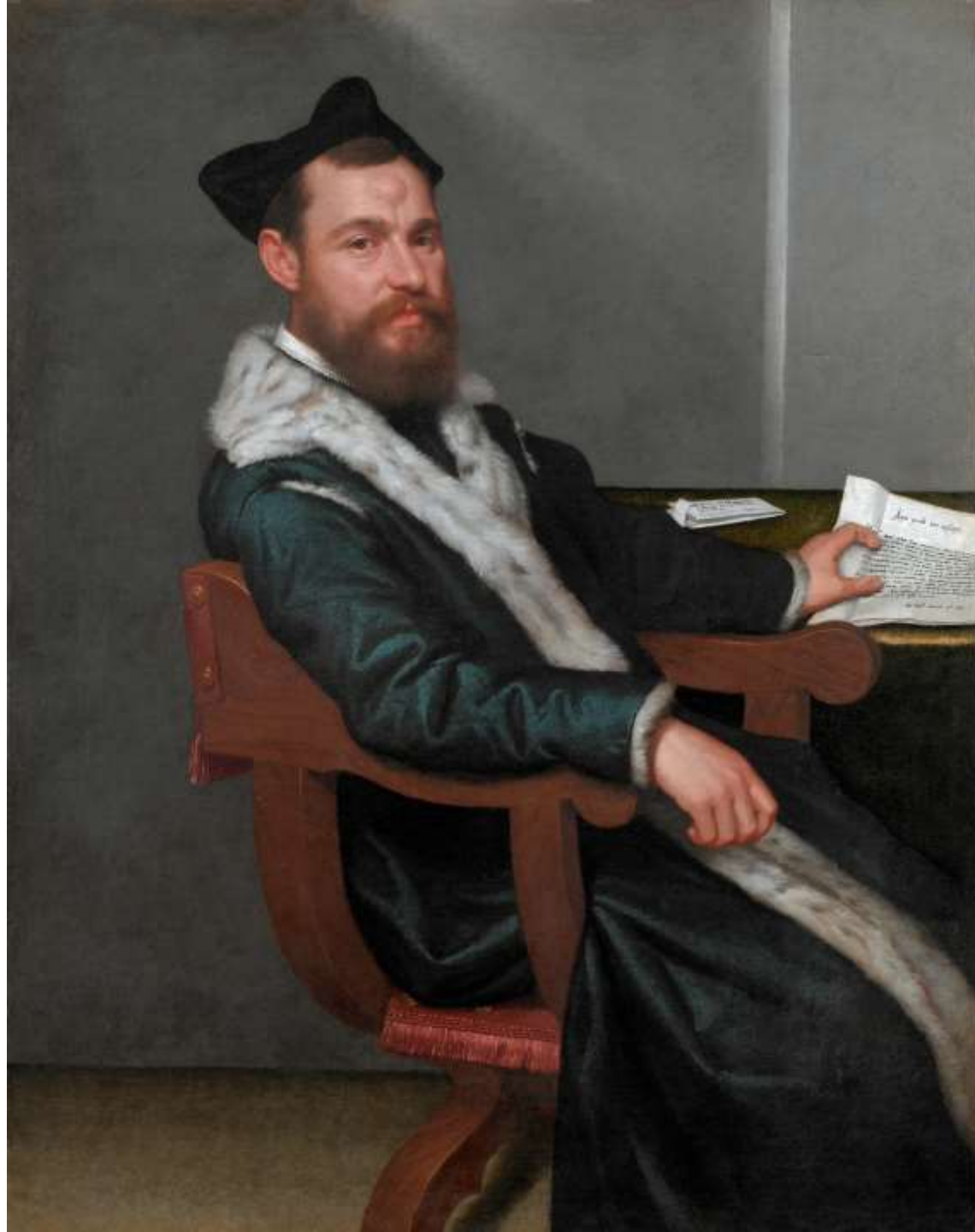
Il Magistrato , 1560 Brescia, Pinacoteca Tosio Martinengo