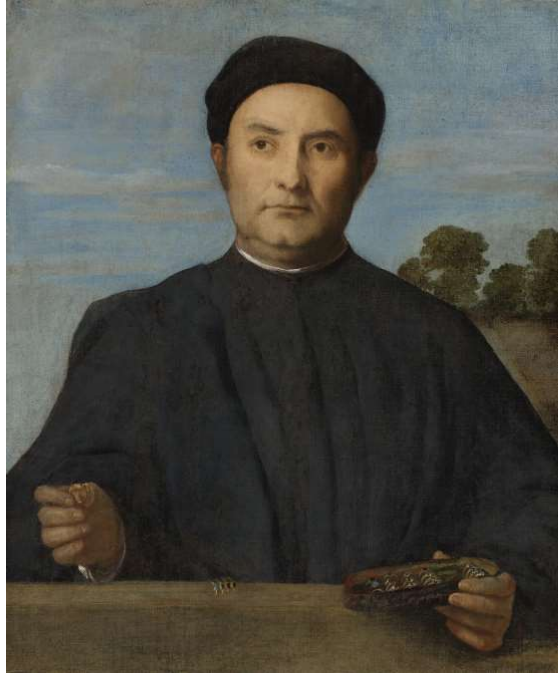
Ritratto di un gioielliere , olio su tela, 1509 – 10 Los Angeles, Getty Museum