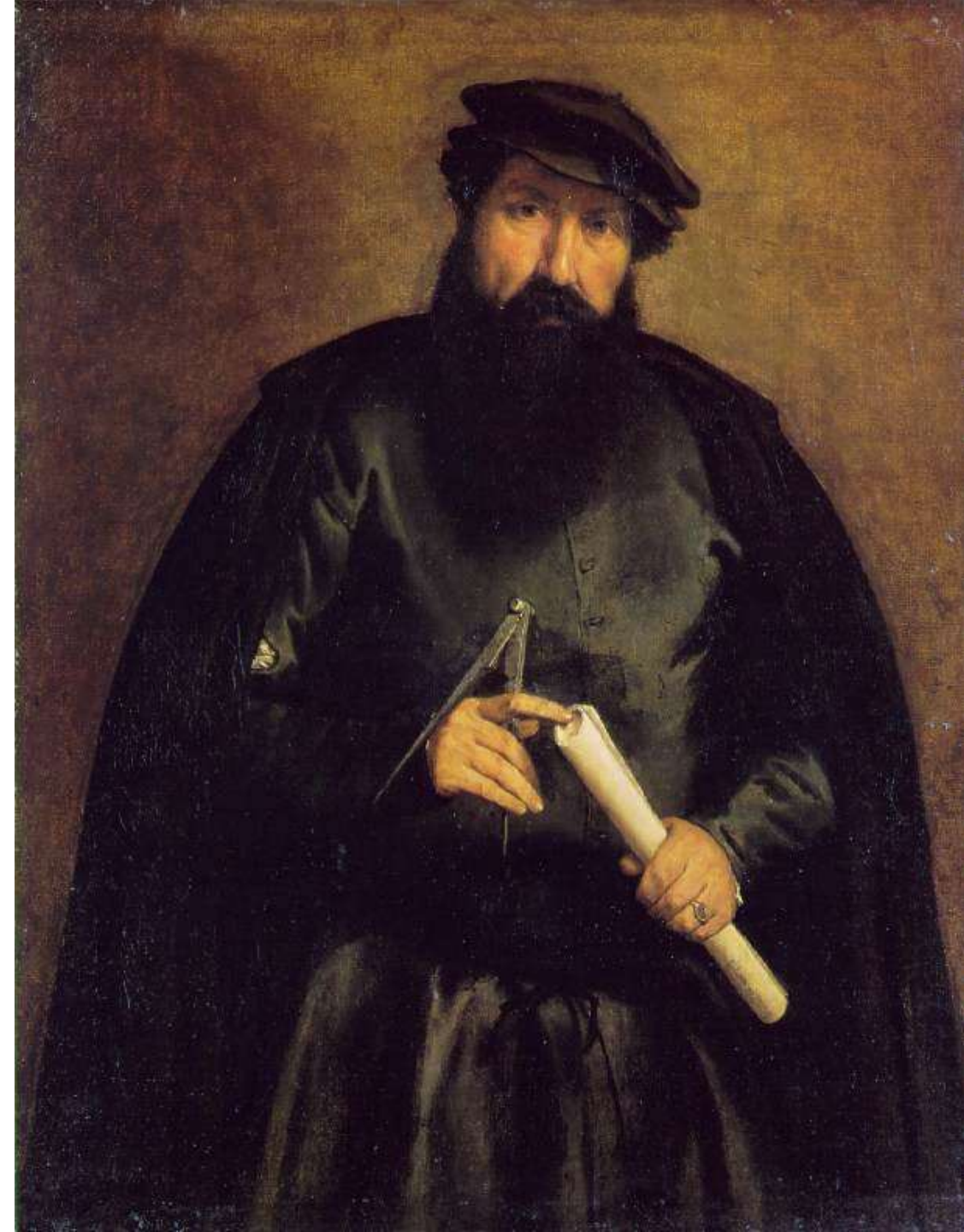
Ritratto di architetto , 1535-40 Berlino, Gemäldegalerie