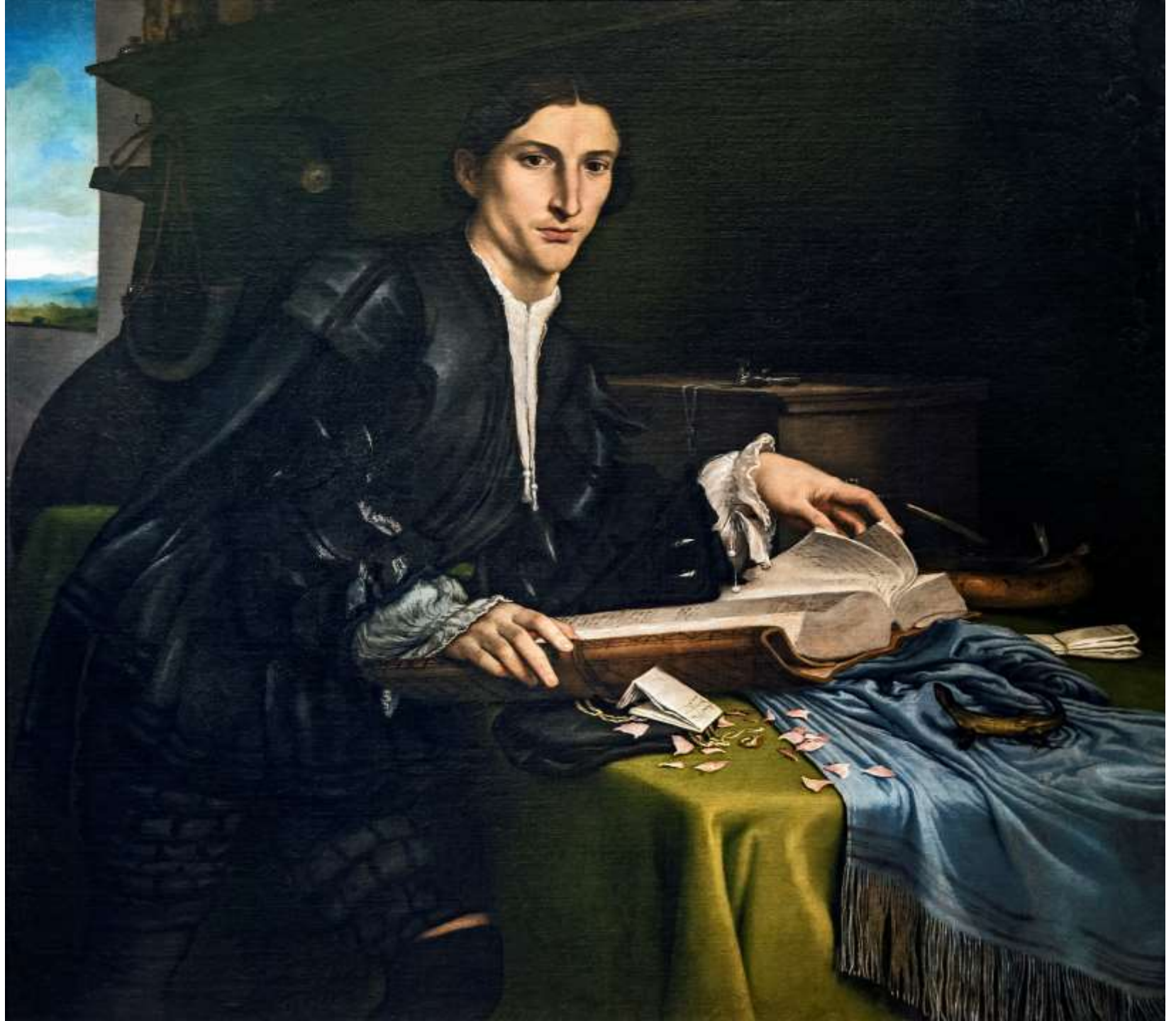
Ritratto di giovane gentiluomo, olio su tela, 1528/29 Venezia, Gallerie dell'Accademia