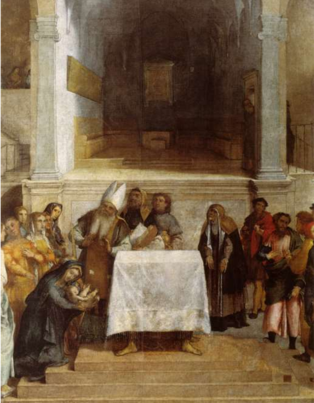
Presentazione di Gesù al Tempio , 1555 ca Loreto, Museo Pinacoteca della Santa Casa