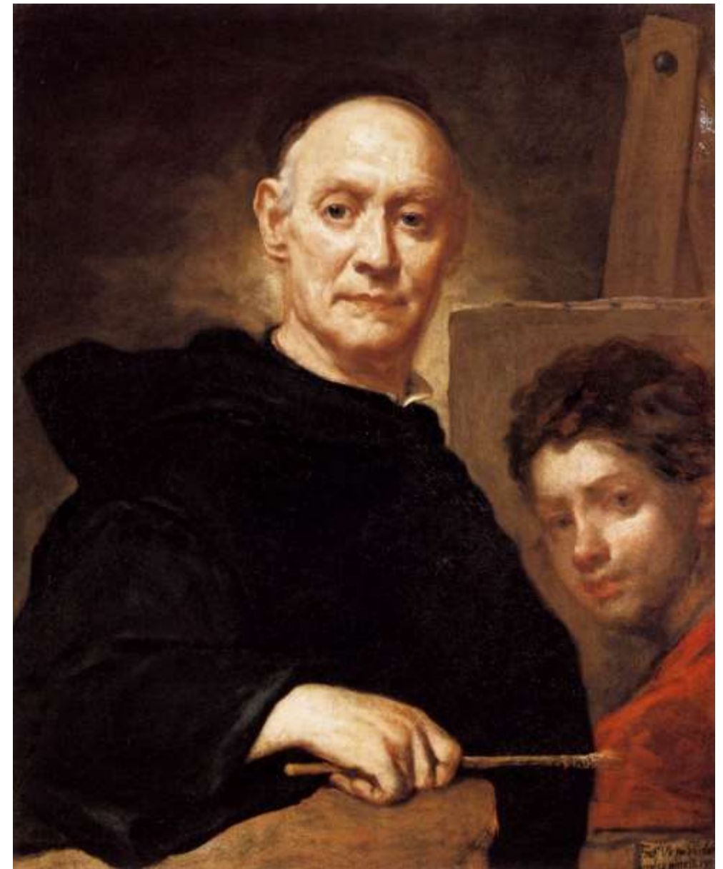
Autoritratto , 1732, Bergamo Accademia Carrara