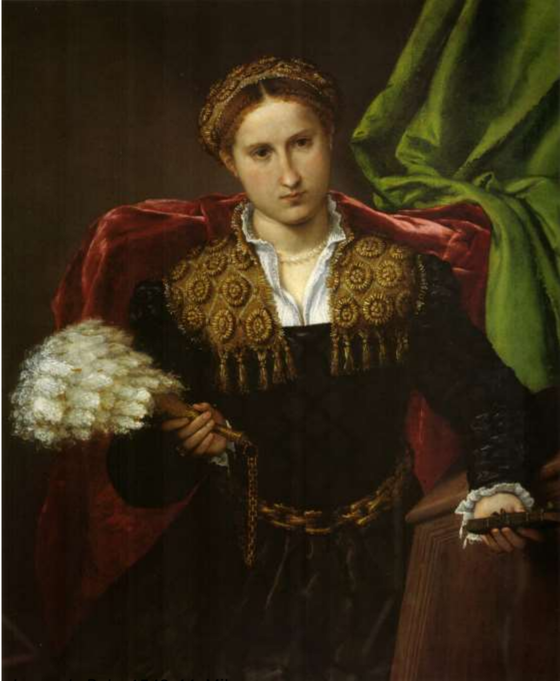
Laura da Pola , 1543-44, Milano, Pinacoteca di Brera