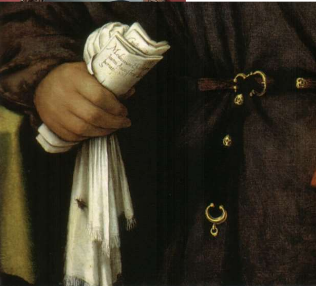
Giovanni Agostino e Niccolò Della Torre, olio su tela 1515 Londra, National Gallery