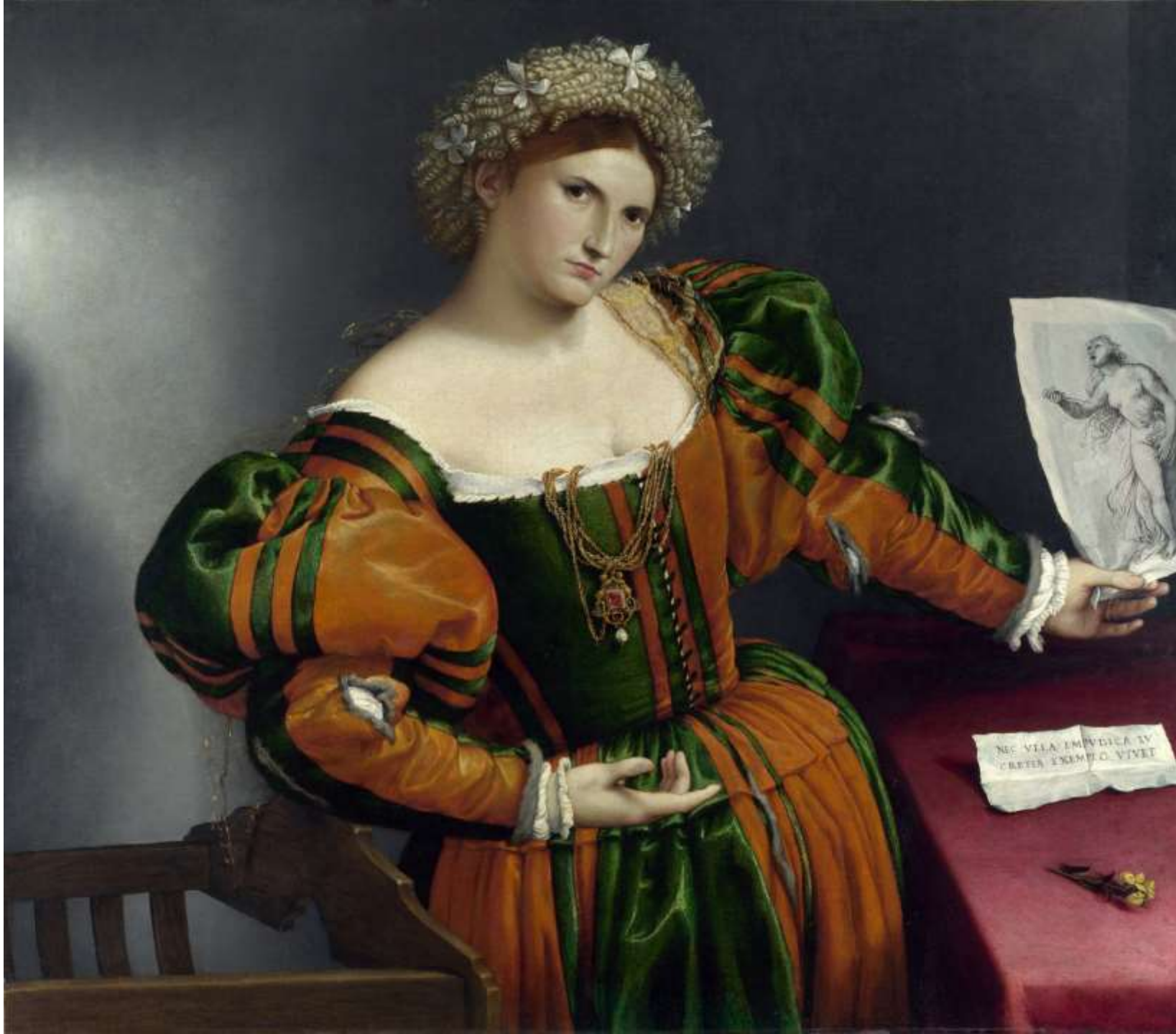
Ritratto di gentildonna in vesti di Lucrezia, olio su tela, 1533 ca Londra, National Gallery