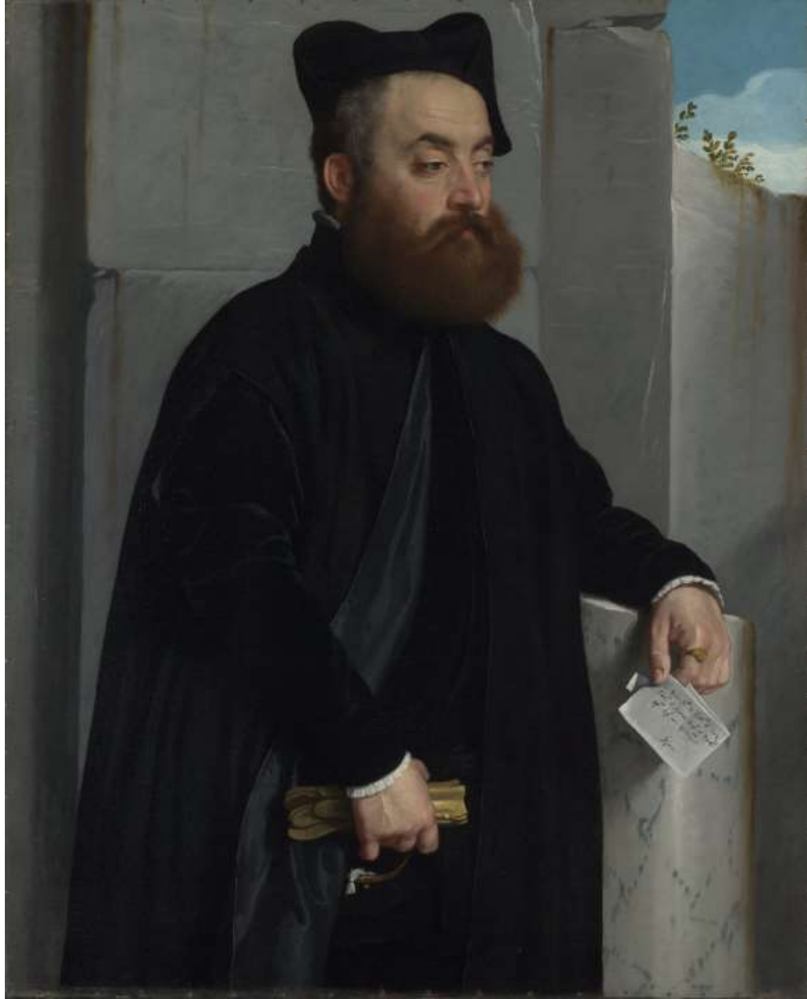
Il canonico Ludovico Terzi, 1559 Londra, National Gallery