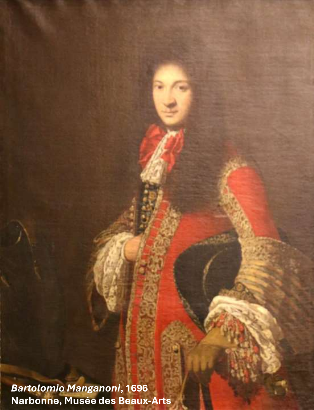
Bartolomio Manganoni, 1696 Narbonne, Musée des Beaux-Arts