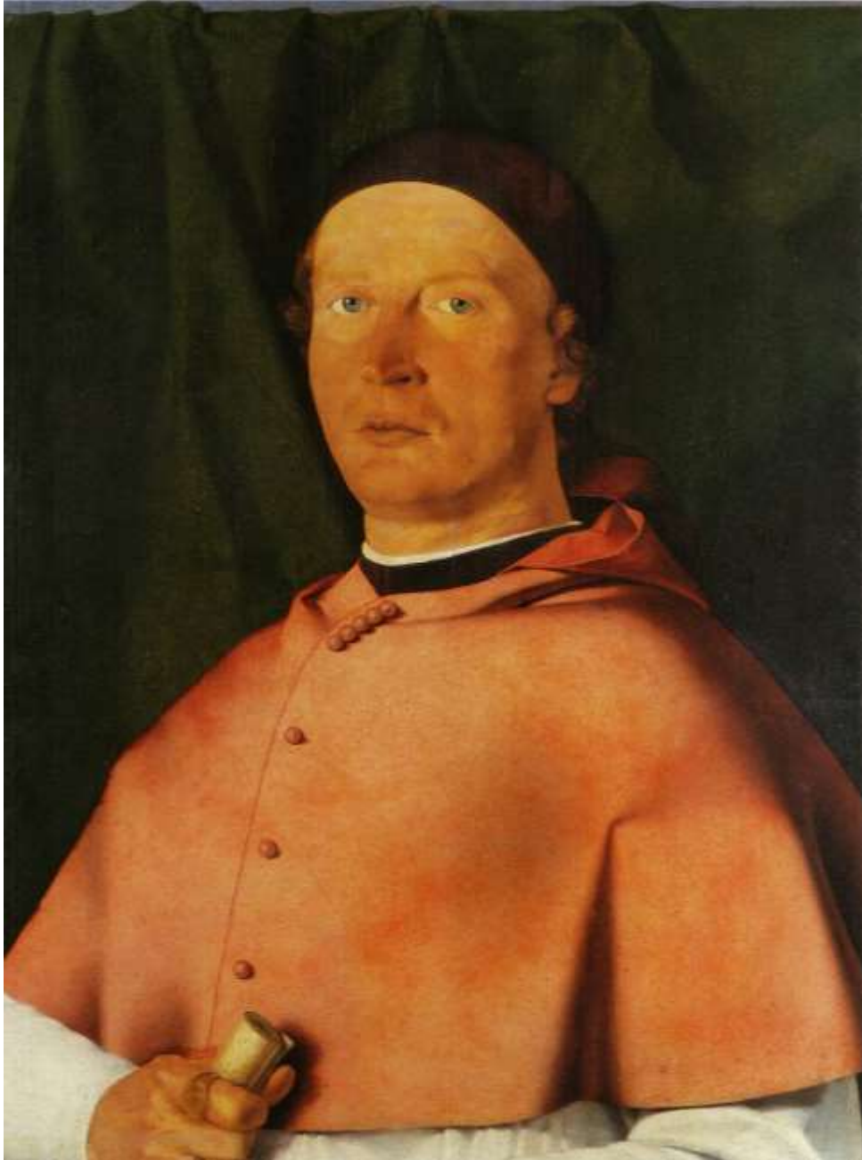
Ritratto del vescovo Bernardo de' Rossi, olio su tavola, 1505 Napoli, Museo nazionale di Capodimonte