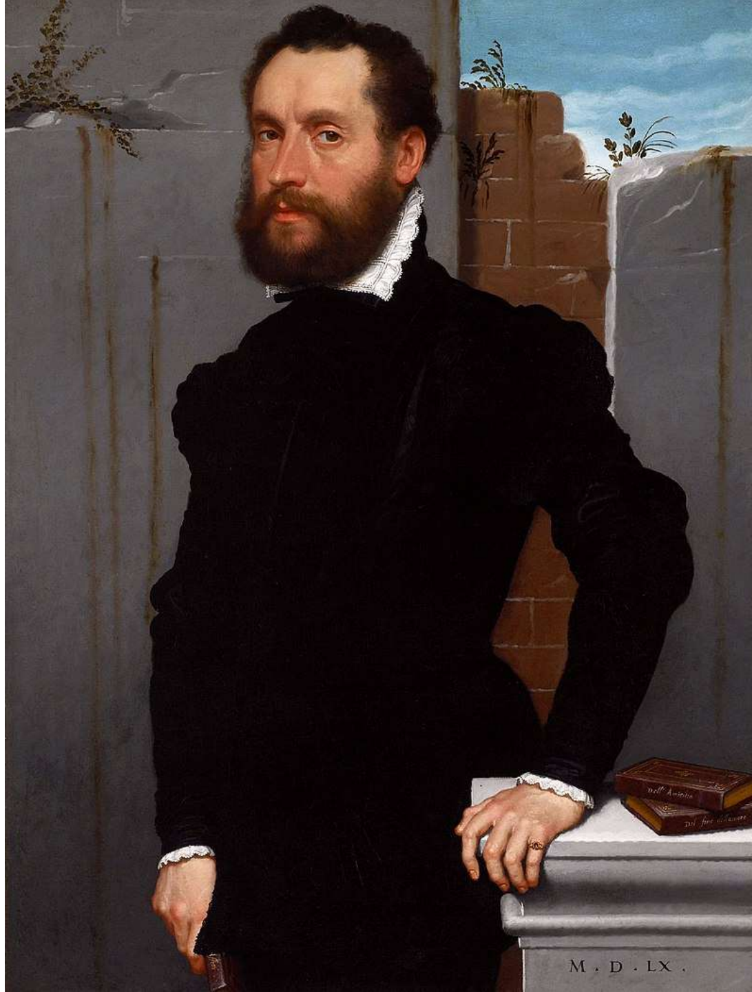
Ritratto di poeta sconosciuto, 1560 Brescia, Pinacoteca Tosio Martinengo