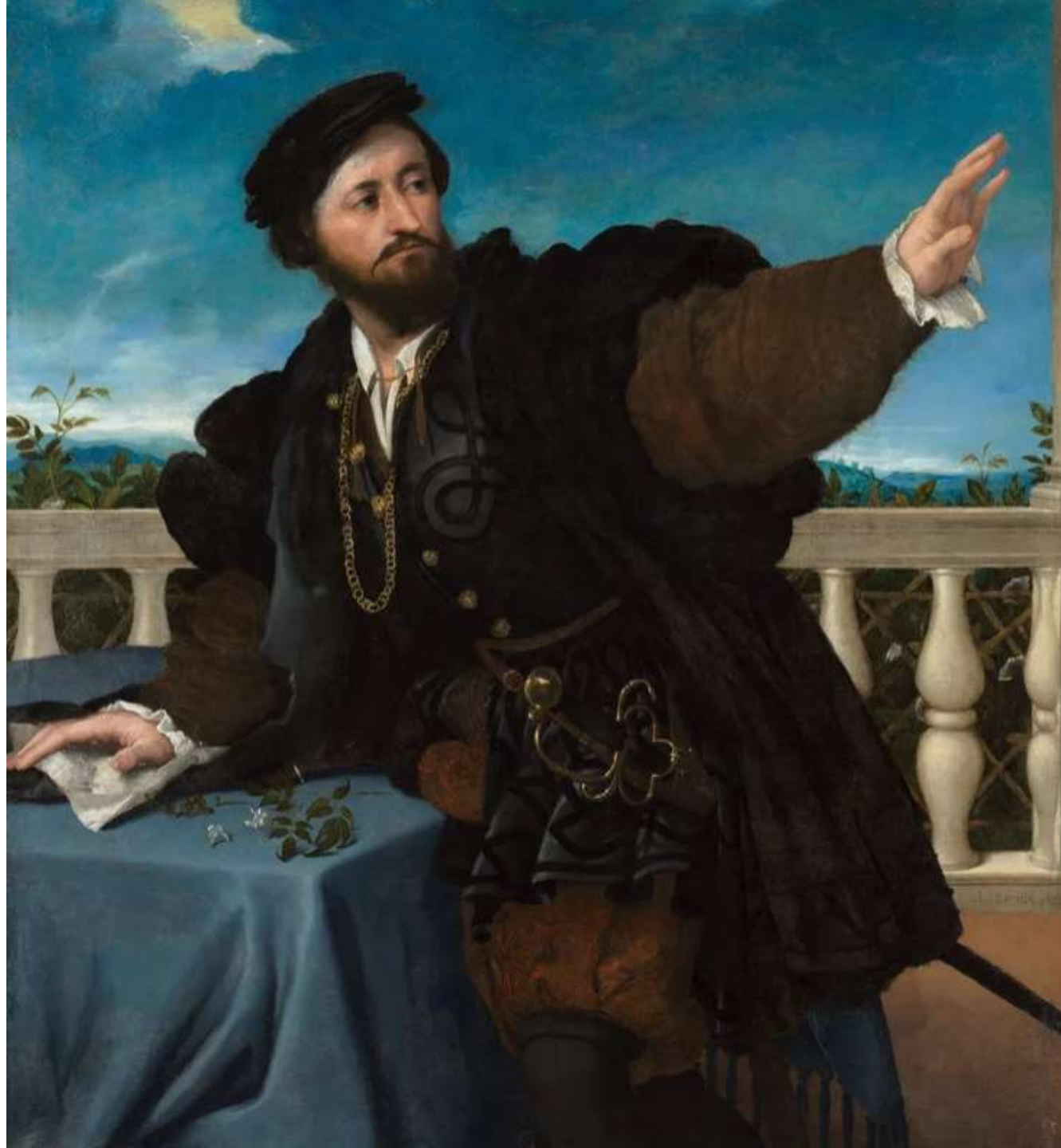
Ritratto di Girolamo Rosati , 1534 Cleveland, Museum of Art