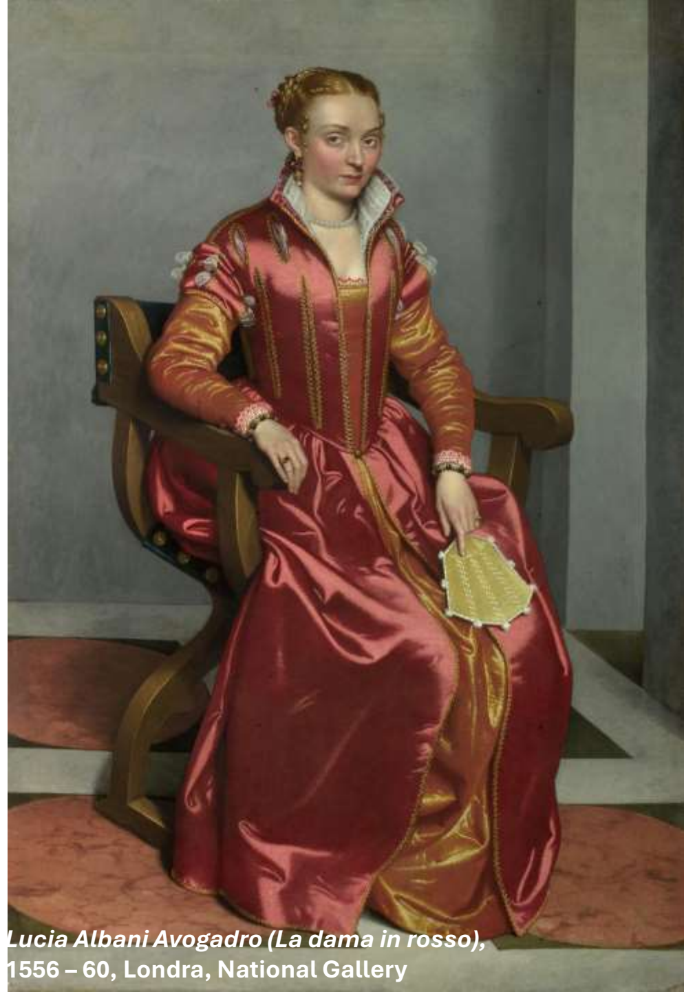
Lucia Albani Avogadro (La dama in rosso), 1556 – 60, Londra, National Gallery