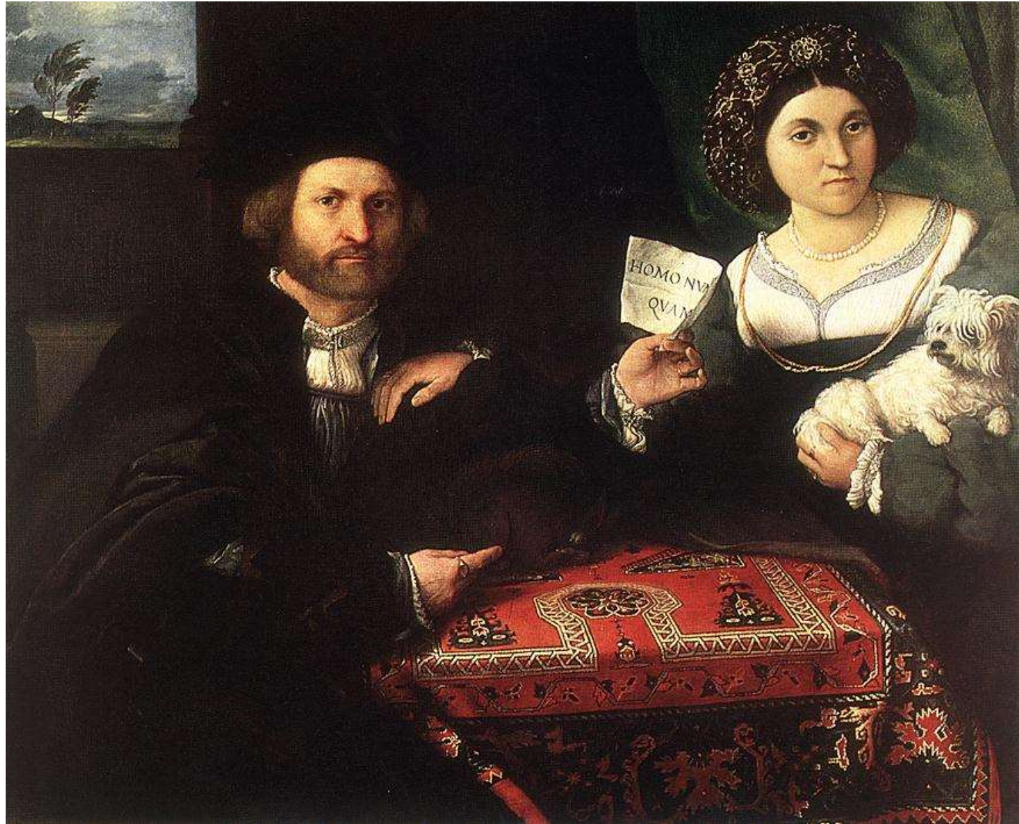
Ritratto di coniugi , olio su tela, 1524 San Pietroburgo, Museo dell'Hermitage