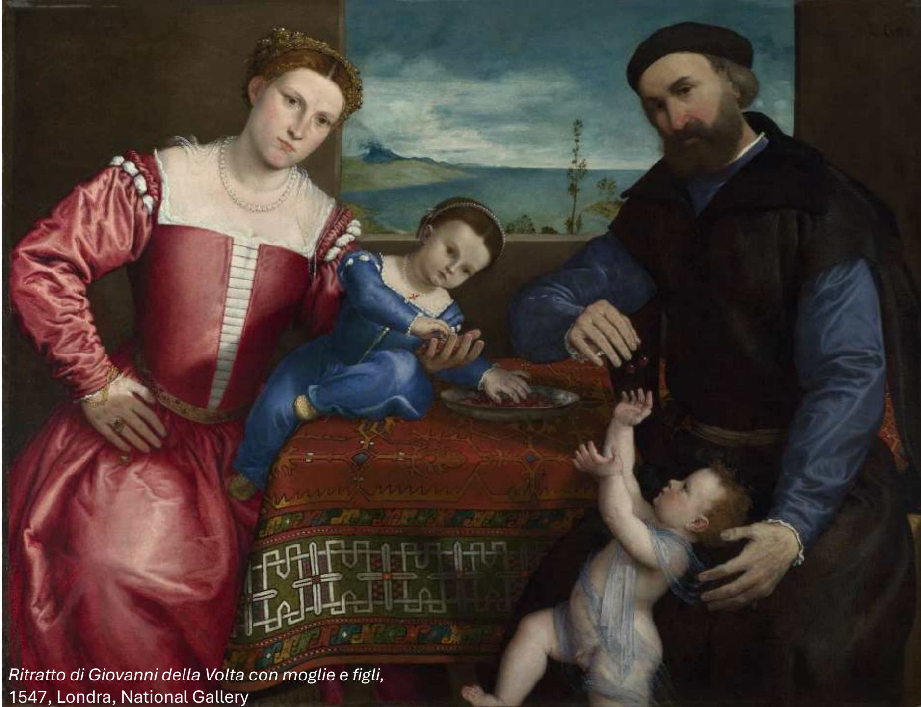
Ritratto di Giovanni della Volta con moglie e figli, 1547, Londra, National Gallery