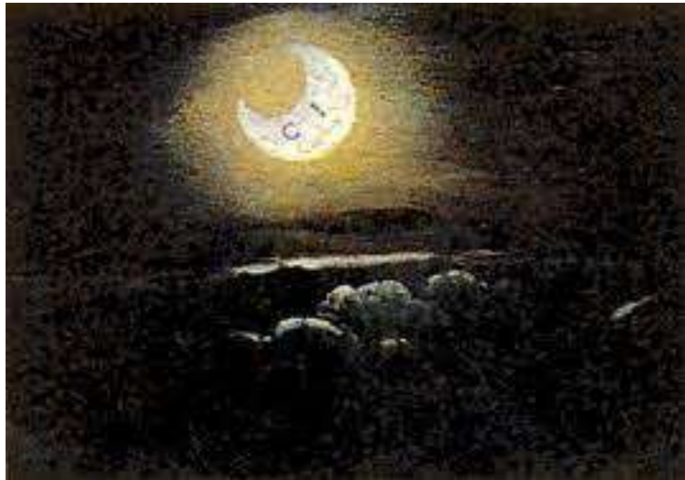
Lucina Brembati , olio su tavola 1518 Bergamo, Accademia Carrara