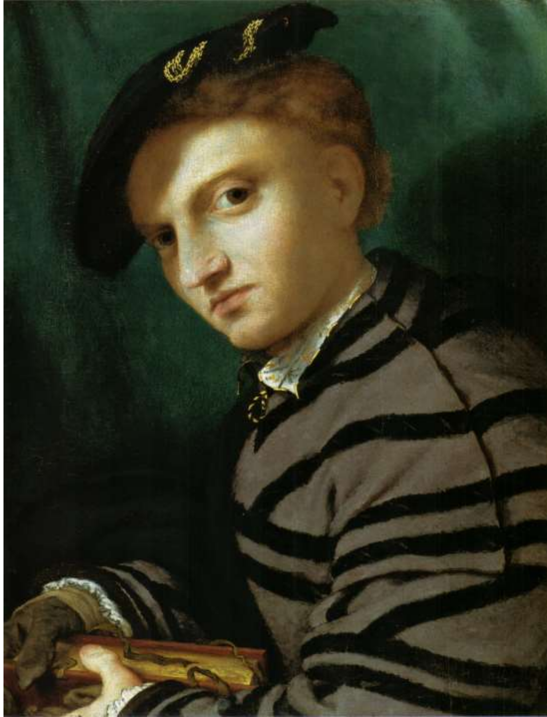
Ritratto di giovane con libro, 1526 Milano, Castello Sforzesco