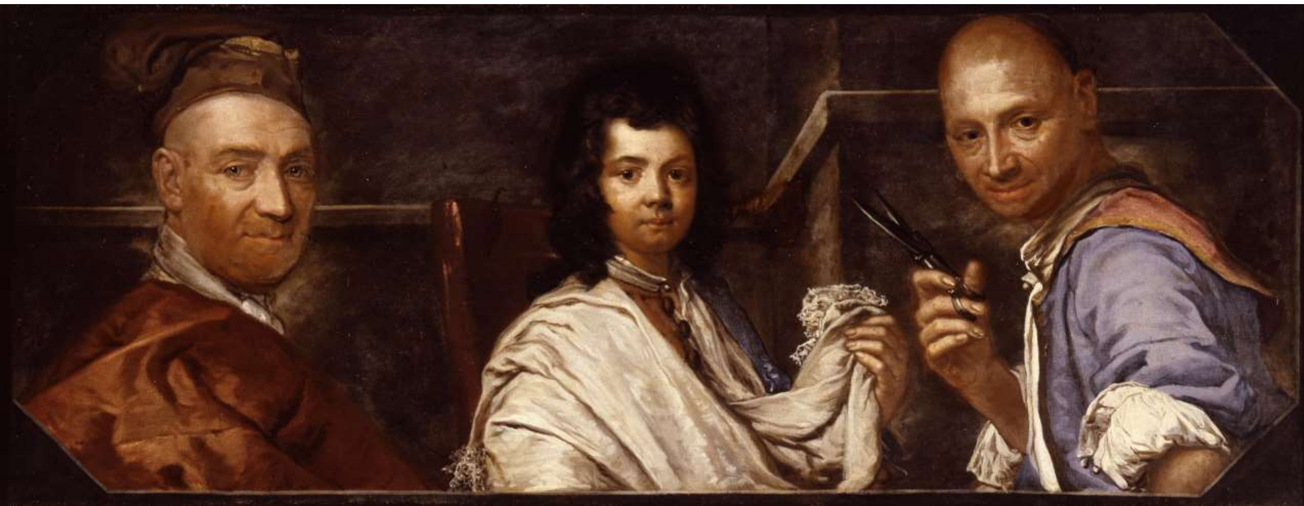
Insegna del barbiere Oletta, con garzone e lavorante, 1730, Bergamo Accademia Carrara