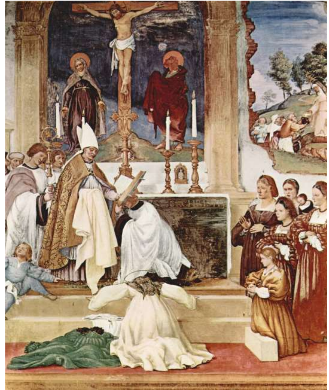
Storie di Santa Brigida, Oratorio Suardi di Trescore, 1524