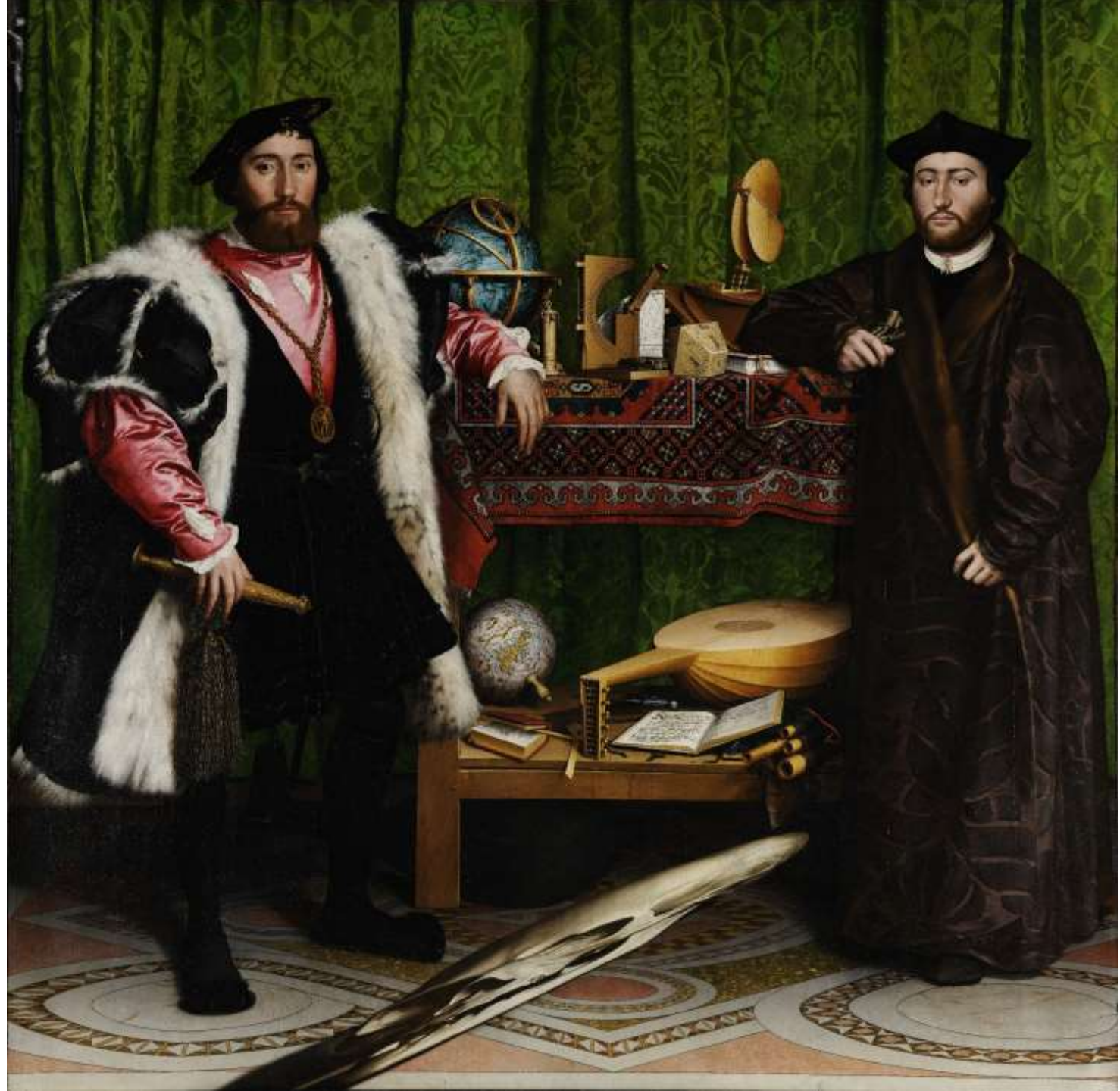
Hans Holbein il Giovane, Gli ambasciatori , 1533 Londra, National Gallery