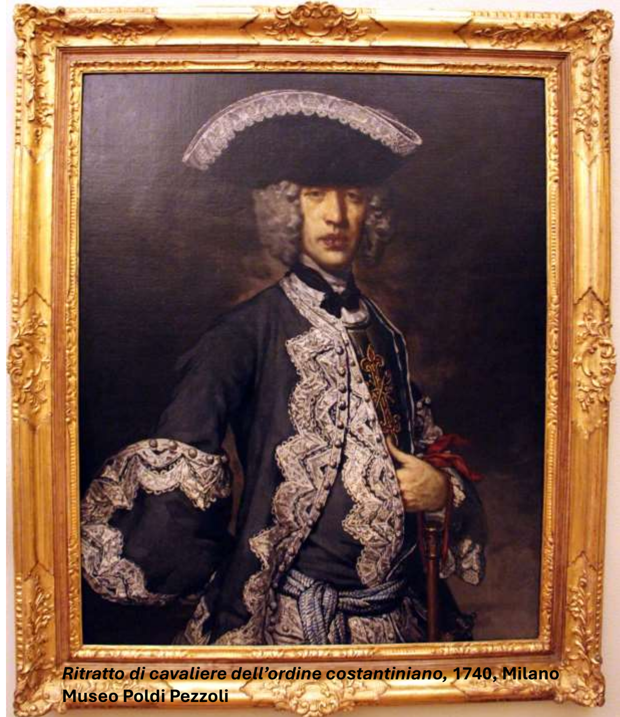
Ritratto di cavaliere dell'ordine costantiniano, 1740, Milano Museo Poldi Pezzoli