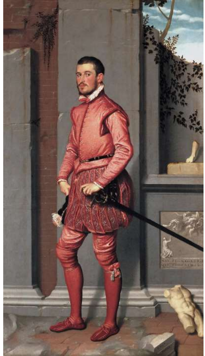
Gian Gerolamo Grumelli, il Cavaliere in rosa, 1561 Bergamo, Palazzo Moroni