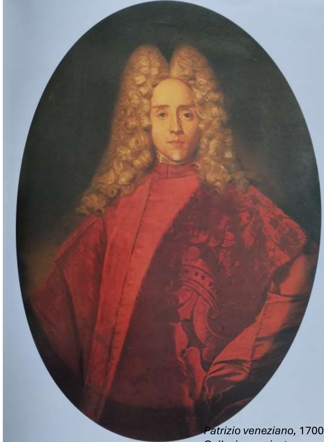
Patrizio veneziano, 1700 ca Collezione privata