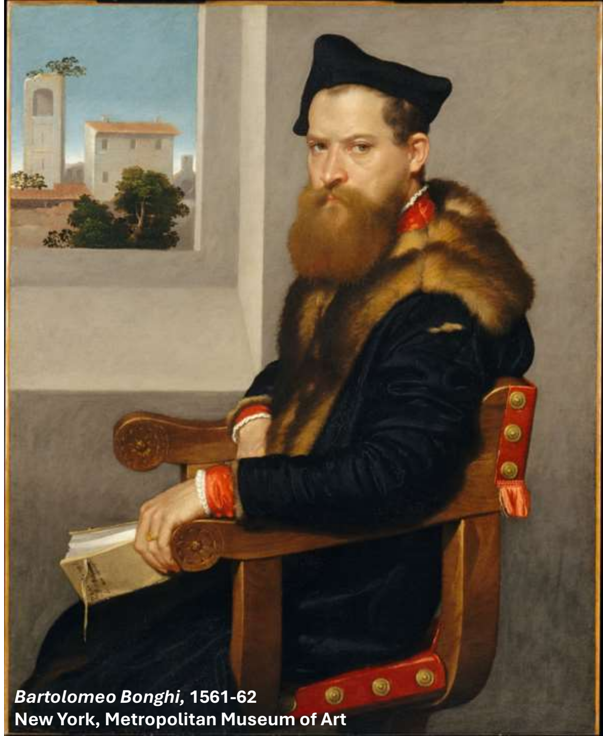
Bartolomeo Bonghi, 1561-62 New York, Metropolitan Museum of Art