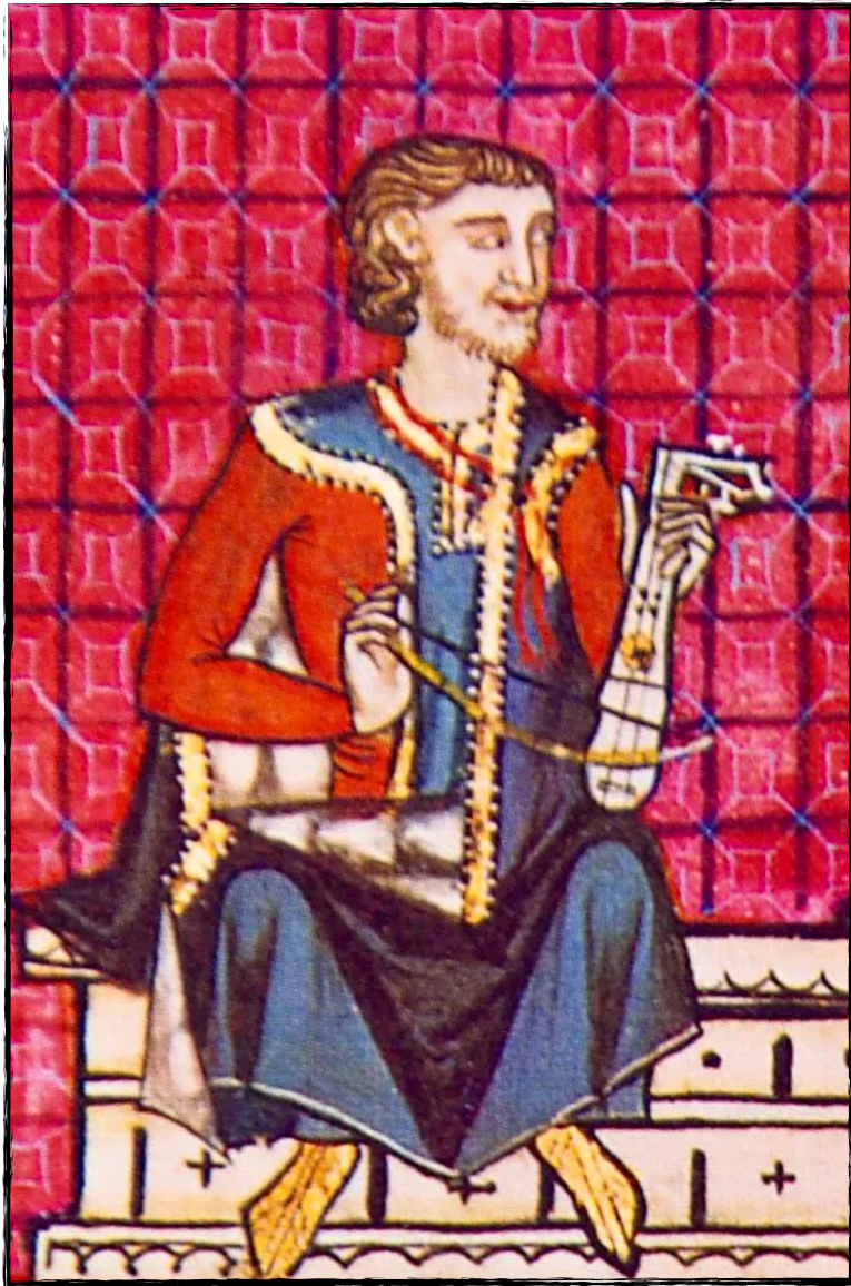
Vihuela de arco