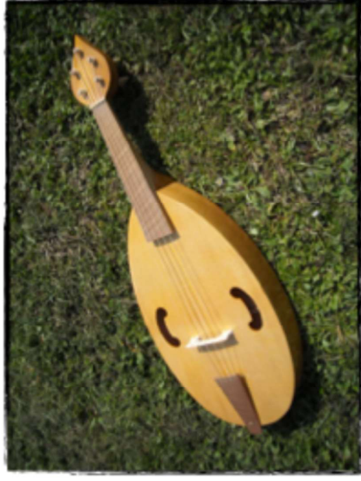
Viella de Cantigas e del Re David